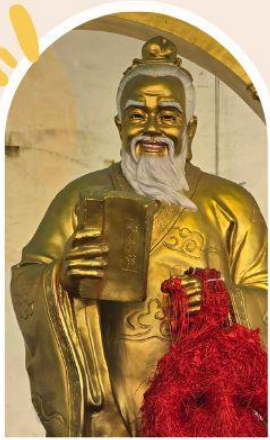
วัดหวังต้าเซียน ขอพรสุขภาพ ความรัก