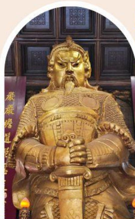
วัดแซกง ขอพรโชคลาง การเงิน และธุรกิจ