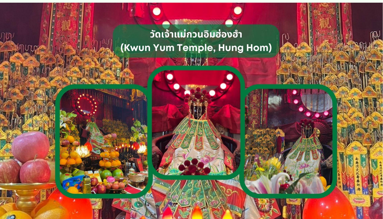
วัดเจ้าแม่กวนอิมฮ่องกง (Kwun Yum Temple, Hung Hom)

นำท่านเดินทางสู่ วัดเจ้าแม่กวนอิมฮ่องกง (Kwun Yum Temple, Hung Hom) เป็นวัดเล็กๆ อันเก่าแก่ ถูกสร้างมาตั้งแต่ปี พ.ศ. 2416 วัดนี้เคยมีปาฏิหาริย์เกิดขึ้น เมื่อช่วงสงครามโลกครั้งที่ 2 มีการปล่อยระเบิดลงบริเวณวัดฮ่องกงหลายต่อหลายครั้ง ซึ่งทำให้มีผู้บาดเจ็บล้มตายเป็นจำนวนมากทว่าชาวบ้านที่เข้าไปหลบภัยในวัดฮ่องกงกลับปลอดภัยไม่ได้รับความบาดเจ็บ รวมถึงตัววัดก็ไม่ได้ได้รับความเสียหายแบบน่าเหลือเชื่อ จึงทำให้