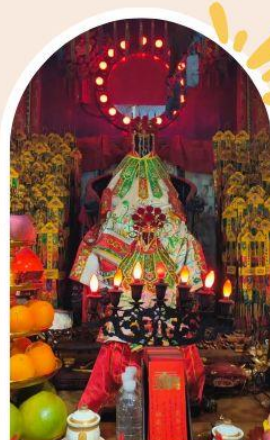
วัดเจ้าแม่กวนอิมอ่องฮำ ขอพรเรื่องเงิน ทรัพย์สิน และความมั่งคั่ง