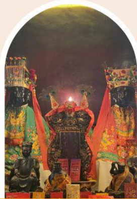
วัดหม่านโหมว การศึกษา การงาน สติปัญญา