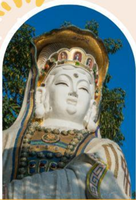
ริพลัสเบย์ รับพลังงานดี เสริมพลังฮวงจุ้ย

"ไหว้พระ เสริมดวง เพิ่มสิริมงคลแก่ชีวิต"