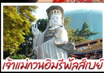
เจ้าแม่กวนอิมรีพลัสเบย์