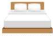
ห้อง Standard Double Room เตียงใหญ่ 1 เตียง Queen Size