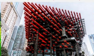
ตึกตะเกียบ