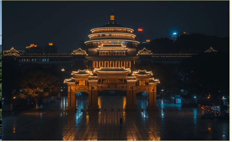
ศาลาประชาชน