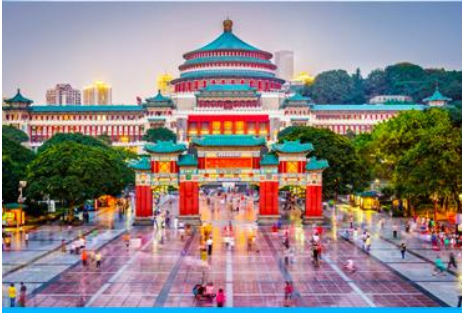
ศาลาประชาชน