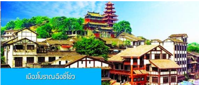
เมืองโบราณฉือชิว

พักที่ HOLIDAY INN EXPRESS HOTEL โรงแรมระดับ 4 ดาวหรือเทียบเท่าในเมืองจิว