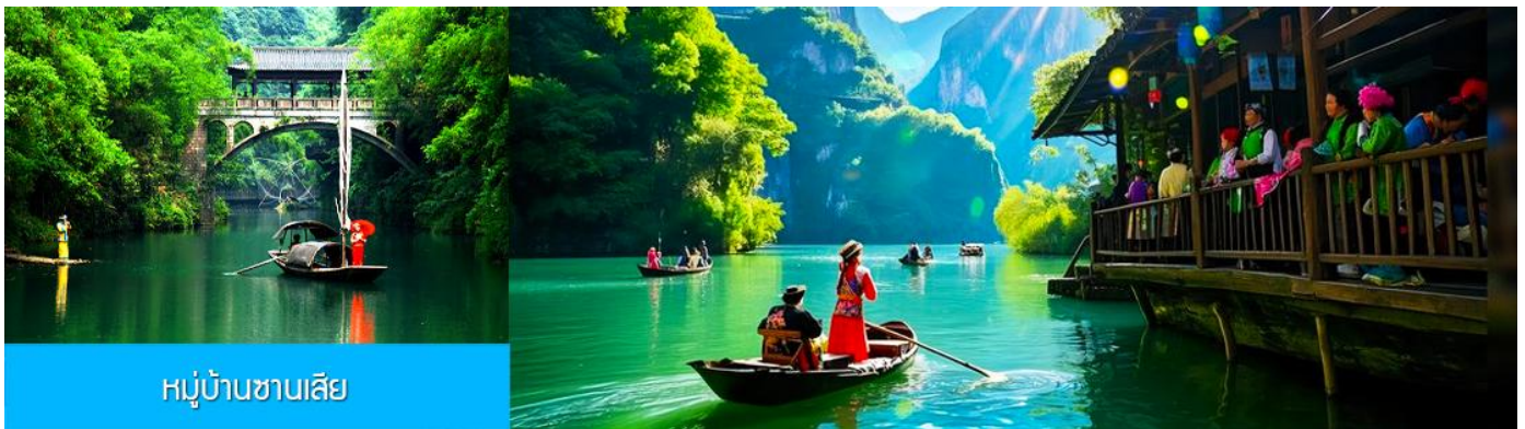
หมู่บ้านชานเสี

พักที่ YICHANG HUIHAO HOTEL โรงแรมระดับ 4 ดาวหรือเทียบเท่าในเมืองหยีซาง