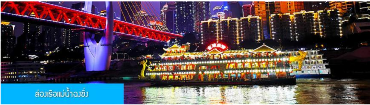
ล่องเรือแม่น้ำจิว