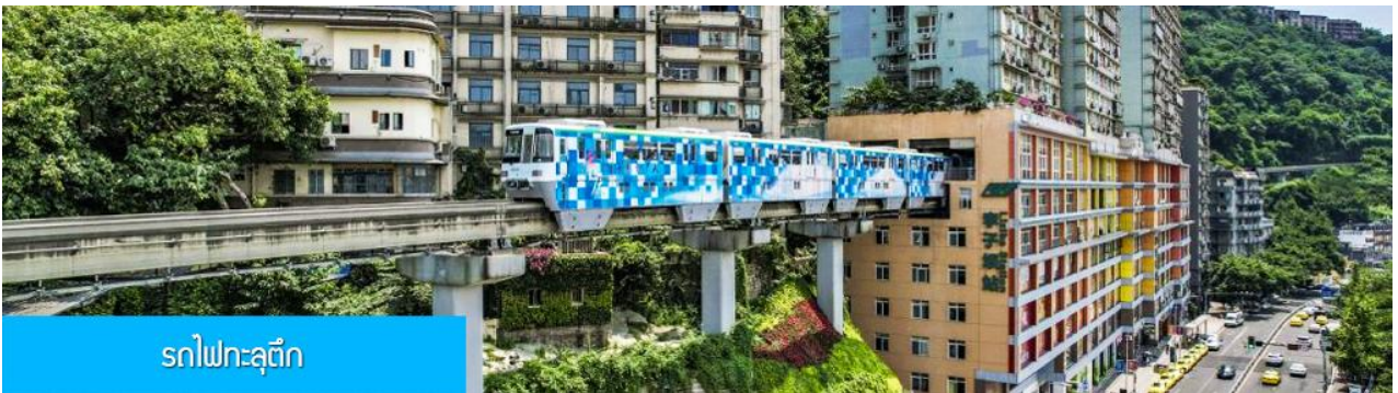
รถไฟทะเลตุ๊ก