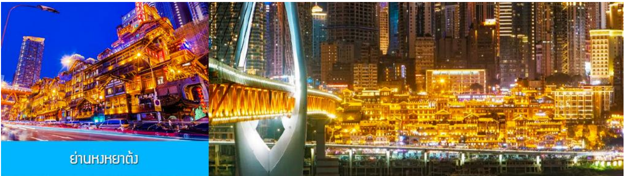
ย่านหงหยาดง