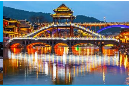
สะพานหงเจียว