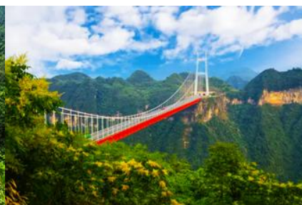
สะพาน ไร่จ้ายต้าเจียว