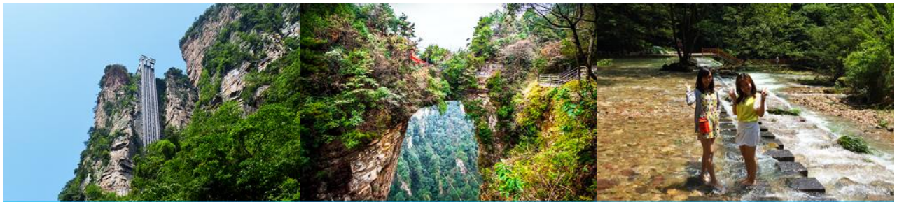
ลิฟท์แก้วไปหลง

หลังอาหารนำท่านเดินทางสู่ อุทยานแห่งชาติจางเจียเจี้ย 张家界森林公园 นำท่านโดยสารรถบัสของเขตอุทยานไปยัง สถานีลิฟท์แก้วไปหลง 百龙天梯 ให้ท่านโดยสารลิฟท์แก้วขึ้นสู่จุดชมวิวในเขตอุทยาน หยวนเจียเจี้ย 袁家界 จุดชมวิวยอดนิยม บนเขาอวตาร ลิฟท์แก้วไปหลง เป็นลิฟท์แก้วชมวิวแบบสองชั้นที่สร้างขึ้นเลียนหน้าผาแนวดิ่งที่มีความสูงราว 325 เมตร เป็น ลิฟท์แก้วชมวิวกลางแจ้งความเร็วสูง ขนาดใหญ่ที่ทำลายสถิติกินเนสบุ๊ค.....ท่านจะตื่นตาตื่นใจกับทัศนียภาพบนเขาอวตาร บนความสูงถึง 1,250 เมตรเหนือระดับน้ำทะเล อาทิ ยอดเขาฮาหลิวยา 哈利路亚山 ภูเขาลอยฟ้าโด่งดังที่เป็นฉากถ่ายทำภาพยนตร์เรื่องอวตาร