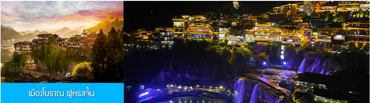
เมืองโบราณ ฟุหยงเจิ้น