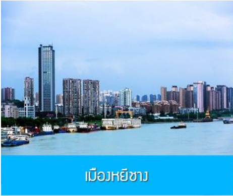
เมืองหยี่ชาง