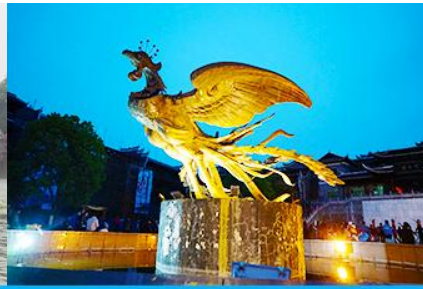
จัตุรัสหงส์