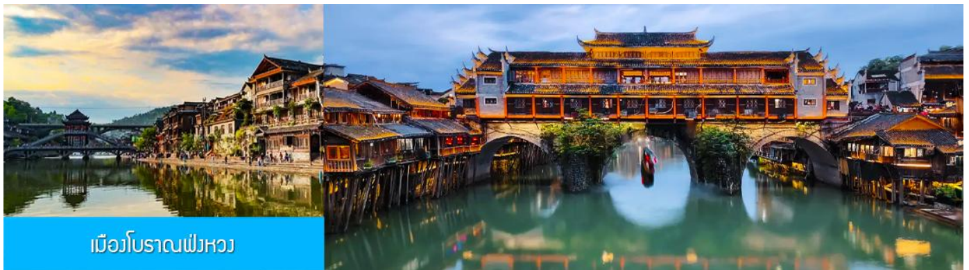
เมืองโบราณฟ่งหวง

หลังอาหารนำท่านเดินทางโดยรถบัสสู่ เมืองโบราณฟ่งหวง (เมืองหงส์) 凤凰古城 (ระยะทาง 189 กม. ใช้เวลาเดินทางประมาณ 2 ชั่วโมงครึ่ง) เมืองโบราณฟ่งหวงตั้งอยู่ในเขตปกครองตนเองของชนเผ่าถู่เจี๋ย ริมน้ำฉางเจี๋ยทางทิศตะวันตกของมณฑลหูหนาน ล้อมรอบด้วยขุนเขาและเป็นด่านช่องแคบภูเขาฟ่งหวง ตั้งเด่นตระหง่านเสมือนป้อมปราการ ธารน้ำฉางเจี๋ยใสสะอาดราวน้ำบริสุทธิ์ที่ถูกกั้นกรองจนมองเห็นก้นลำธาร ชุมชนริมน้ำที่เป็นบ้านเรือนจีนโบราณแบบยกพื้นสูงเรียงรายกันริมน้ำ ฉ่างเป็นทัศนียภาพที่สวยงามมีเสน่ห์ของเมืองโบราณฟ่งหวง ราวกับดินแดนมนุษย์ที่สร้างอยู่บนสวรรค์..