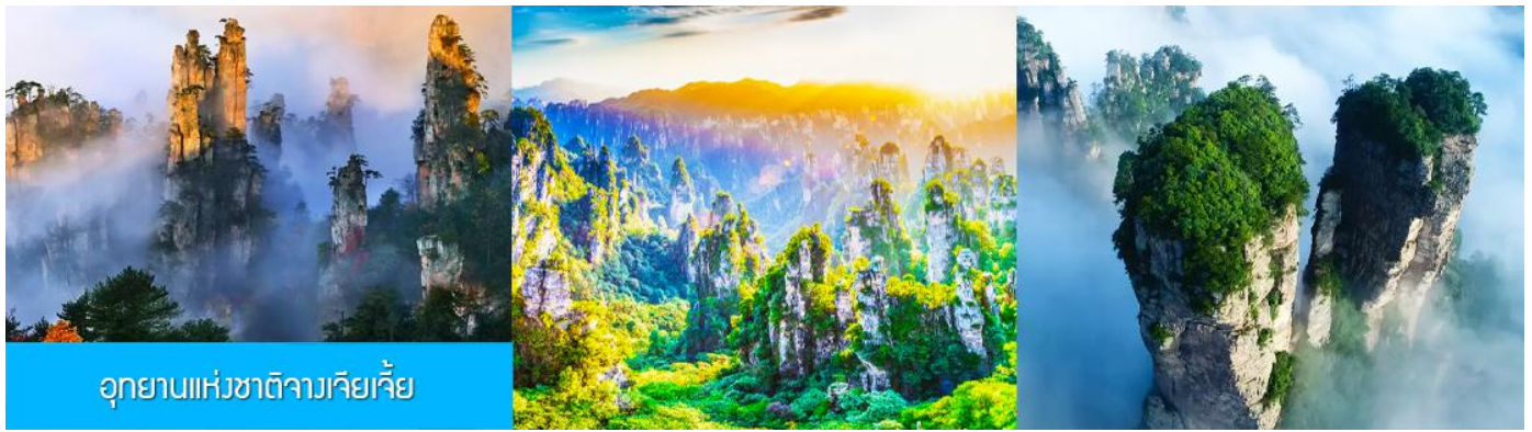
อุทยานแห่งชาติจางเจียเจี้ย

วันที่ห้า เมืองโบราณผู่หรงจิน-เมืองจางเจียเจี้ย-ภูเขาอวตาร-ไกด์นำเสนอ OPTIONAL TOUR -เดินทางกลับเมืองหยีซาง