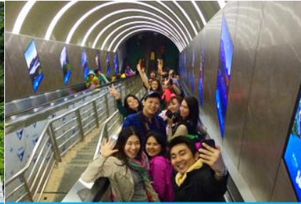
บันไดเลื่อนทะลุภูเขา