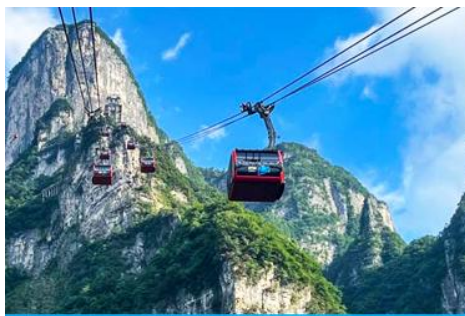
กระเช้าขึ้นเขาเทียนเหมินซาน

พักที่ HANTING HOTEL ระดับ 4 ดาวท้องถิ่นหรือเทียบเท่าในเมืองจางเจียเจี๋ย