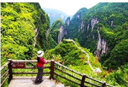
แก่ง ปูจางสวรรค์

พักที่ ZUIXIANGXI HOTEL ระดับ 4 ดาวท้องถิ่นหรือเทียบเท่าในเมืองโบราณฟางหวง