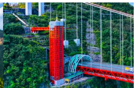
ลิฟท์แก้วอุทยานไร่จ้าย