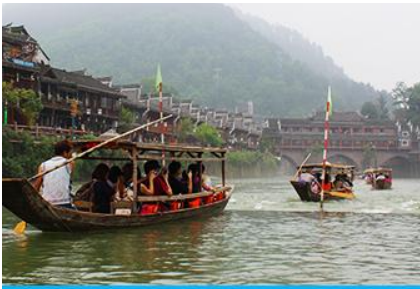
ล่องเรือแม่น้ำถั่วเจียง

หมายเหตุ การเดินทางเข้าเมืองโบราณฟางหวง ต้องนั่งรถเมล์ของเมืองโบราณ ท่านจำเป็นต้องหิวกระเป๋าสัมภาระของท่านขึ้น-ลงรถเมล์ด้วยตัวท่านเอง เพราะรถบัสทัวร์เราไม่สามารถเข้าไปในเมืองโบราณได้ จอดส่ง ณ จุดขนส่งของเมืองโบราณเท่านั้น เมื่อเดินทางถึงเมืองโบราณฟางหวงแล้ว นำท่านเช็กอิน ณ โรงแรมที่พัก(อยู่ในเมืองโบราณใกล้แหล่งท่องเที่ยว)