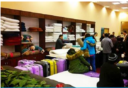
ศูนย์จำหน่ายผลิตภัณฑ์ยาวพารา