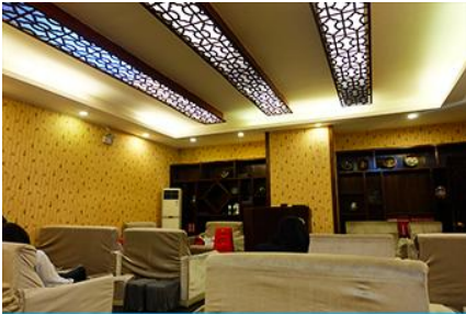
ศูนย์แพทย์แผนจีน

ค่ำ รับประทานอาหารค่ำ ณ ภัตตาคาร (3) พักที่ HANTING HOTEL ระดับ 4 ดาวท้องถิ่นหรือเทียบเท่าในเมืองจางเจี๋ยเจี๋ย