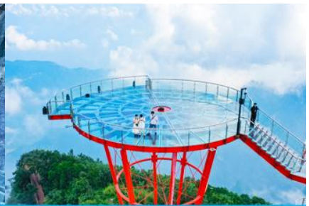
ระเบียงชมวิว Sky Eye

วันที่สี่ พิพิธภัณฑ์ภาพเขียนหินทราย-ศูนย์ผลิตภัณฑ์ที่ทำจากยางพารา – กระจ่าขึ้นเขาเจ็ดดาว – ระเบียงแก้วเลียบนหน้าผา ระเบียงชมวิว SKY EYE – (ไกด์นำเสนอโปรแกรมเสริม ชุดโชว์จิ้งจอกขาว)