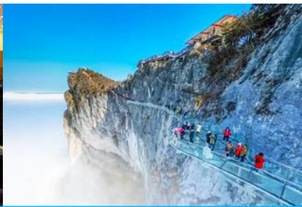
ระเบียงทางเดินกระจกเลียบนหน้าผา