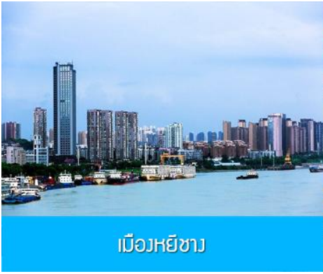
เมืองหยี่ชาง