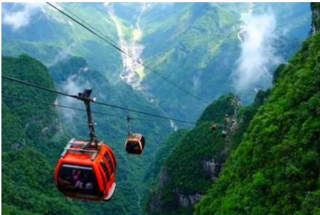
เขาเจ็ดดาว

เที่ยง รับประทานอาหารกลางวัน ณ ภัตตาคาร *บุฟเฟ่ต์หมูย่างเกาหลี (8)