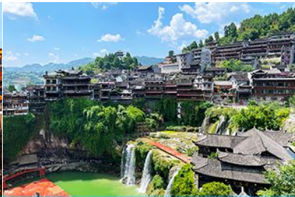
เมืองโบราณฝูหรงจิ้น