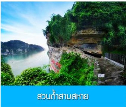
ส่วนท่าสามสหาย