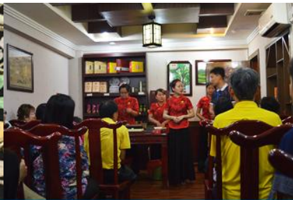
ร้านใบชา