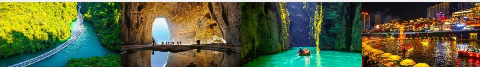
หุบเขาสิงโต