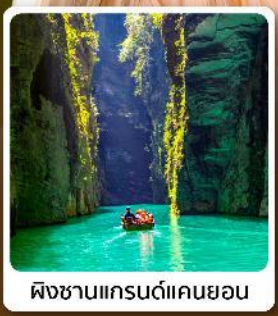
ผิงซานแกรนด์แคนยอน