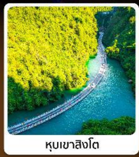
คุบเขาสิงโต

ไฮไลท์! ปืนตรงลงเอ็นซือ ที่ยวเอ็นซือเน้นๆจัดเต็มทั่วเมือง คุบเขาสิงโต ผิงซานแกรนด์แคนยอน อุทยานจิ้นลี่ซาน