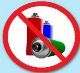
ขวดสเปรย์