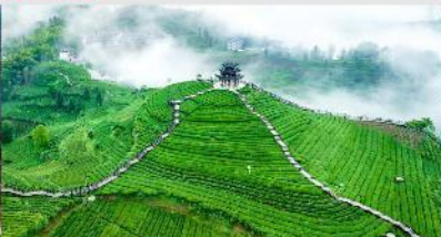
ไร่ชาอู่เจียโต