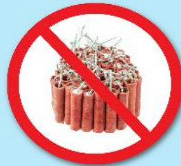
พลุ, ประทัด