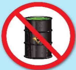
สารกัมมันตรังสี