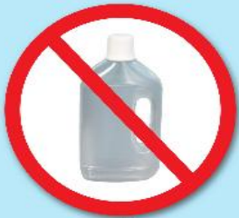
ขวดน้ำยา