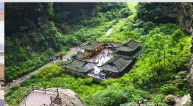
อุทยานแห่งชาติบ่อหลุมฟ้า

*ทางบริษัทฯ ขอสงวนสิทธิ์ในการสลับโปรแกรมทัวร์ตามความเหมาะสมขึ้นอยู่กับสถานการณ์หน้างาน โดยคำนึงถึงผลประโยชน์ของลูกค้าเป็นสำคัญ