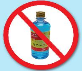
ขวดแอลกอฮอล์