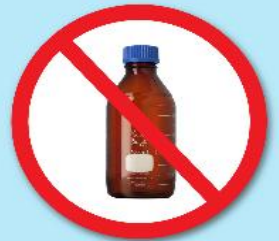
ขวดสารเคมี