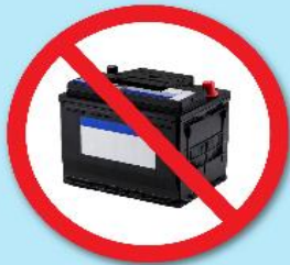
แบตเตอรี่ดำ