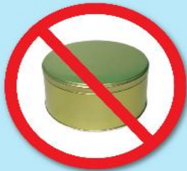
กล่องโลหะ