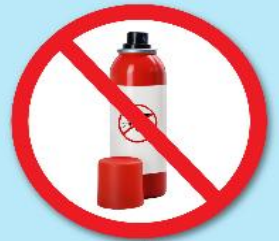
ขวดน้ำยา ฆ่าแมลง