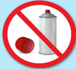
กระป๋องสเปรย์