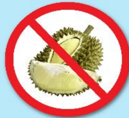
ผลไม้เขตร้อน ที่มีหนาม