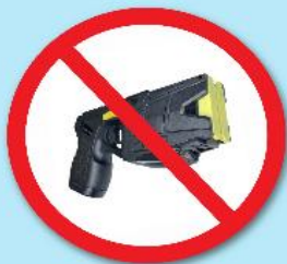
ปืนช็อตไฟฟ้า