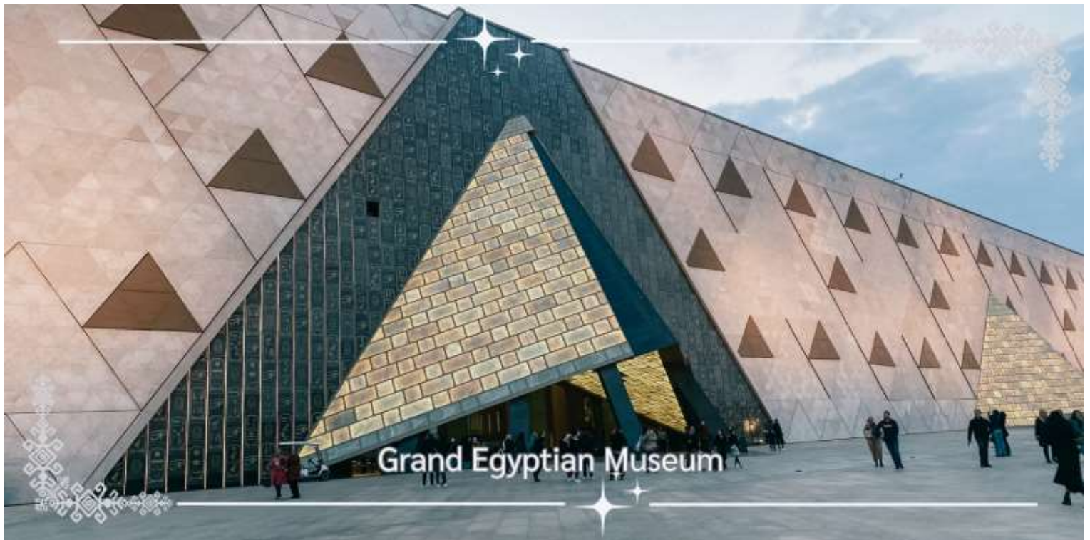
Grand Egyptian Museum

นำท่านสู่ Grand Egyptian Museum พิพิธภัณฑ์แห่งชาติใหม่ที่ยิ่งใหญ่ที่สุดในโลก สัมผัสความยิ่งใหญ่ของอารยธรรมอียิปต์โบราณในรูปแบบที่ล้ำสมัย ณ Grand Egyptian Museum (GEM) หรือ พิพิธภัณฑ์อียิปต์แห่งใหม่ ซึ่งตั้งอยู่ใกล้กับพีระมิดกิซา เป็นพิพิธภัณฑ์โบราณคดีที่ใหญ่ที่สุดในโลกที่อุทิศให้กับอารยธรรมแห่งลุ่มแม่น้ำไนล์อย่างครบวงจร ที่นี่ได้รับการออกแบบให้เป็นแลนด์มาร์คระดับโลกด้วยสถาปัตยกรรมทันสมัย เชื่อมโยงอดีตกับปัจจุบันอย่างลงตัว ไฮไลต์สำคัญคือคอลเลกชันเต็มรูปแบบของตุตันคาเมน (Tutankhamun) รวมถึงสมบัติทองคำ อุปกรณ์ใช้สอย และโลงศพที่ไม่เคยจัดแสดง