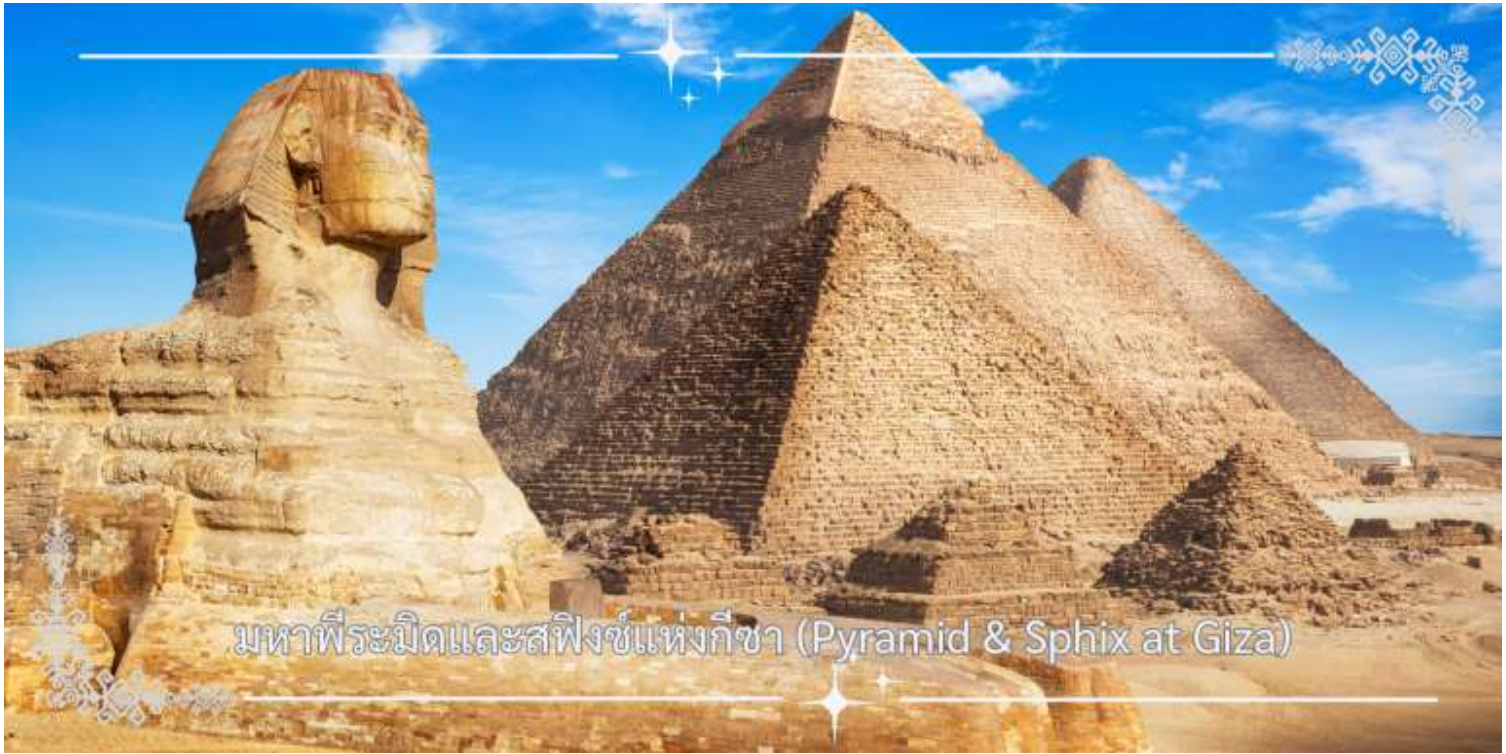
มหาพีระมิดและสฟิงซ์แห่งกิซา (Pyramid & Sphinx at Giza)