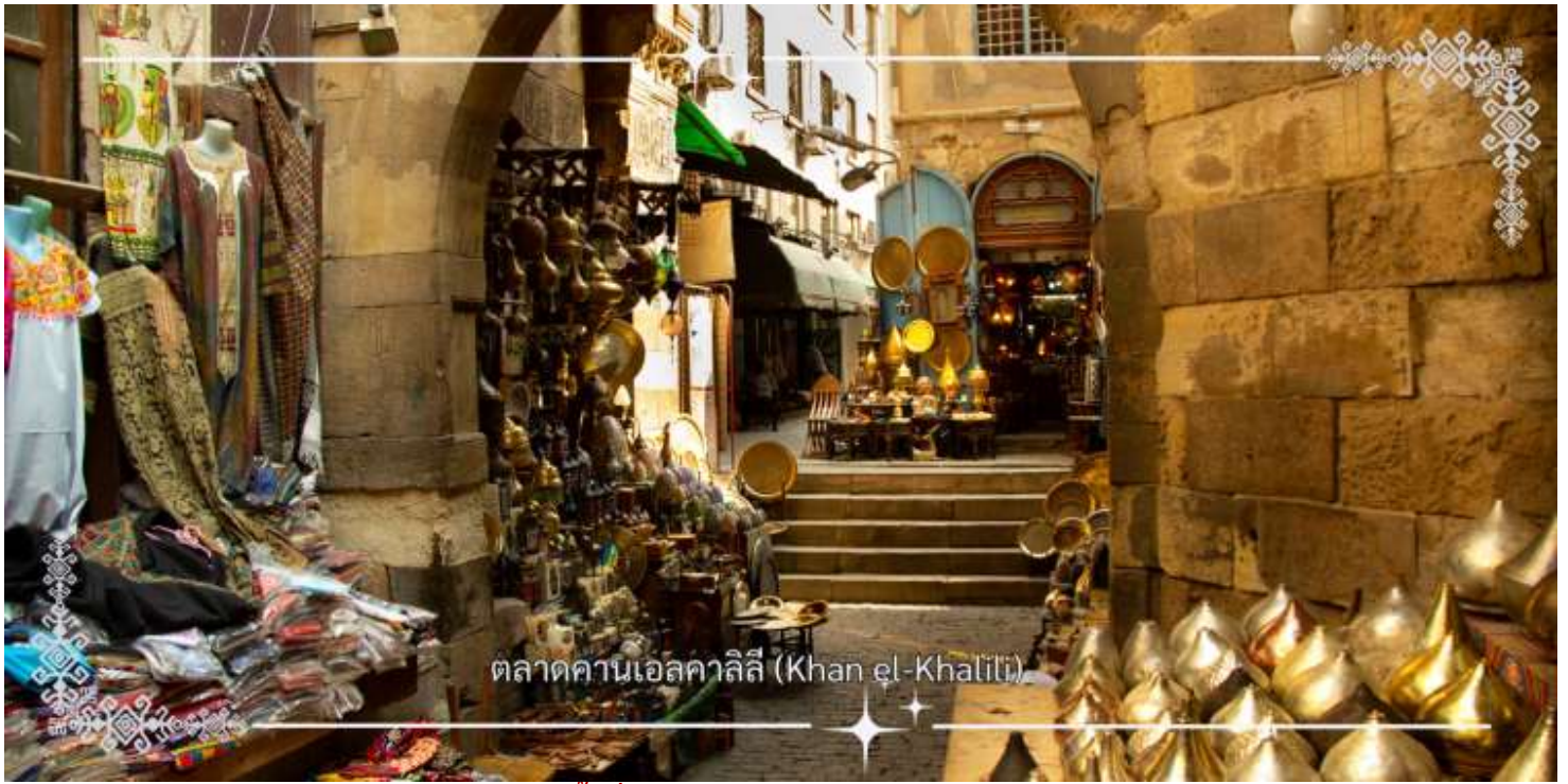
ตลาดคานเอลคาลิลี (Khan el-Khalili)

เย็น บริการอาหารเย็น ณ ภัตตาคาร (มือที่8) อาหารไทย