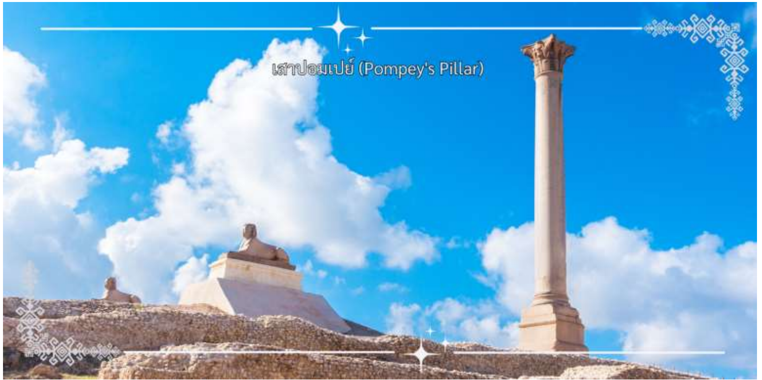
เสาปอมเปย์ (Pompey's Pillar)

ได้เวลาอันสมควร เดินทางสู่สนามบินอเล็กซานเดรีย เพื่อเดินทางกลับ