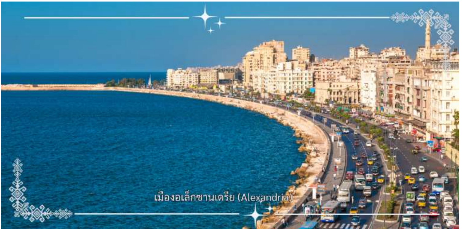
เมืองอเล็กซานเดรีย (Alexandria)

หลังอาหารเช้า นำท่านเดินทางสู่ เมืองอเล็กซานเดรีย (Alexandria) (ใช้เวลาประมาณ 3 ชั่วโมง) เมืองท่าทางเหนือของ อียิปต์ที่ตั้งอยู่ริมทะเลเมดิเตอร์เรเนียน คือเมืองแห่งประวัติศาสตร์ วัฒนธรรม และความโรแมนติก ก่อตั้งขึ้นเมื่อปี 331 ก่อน