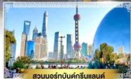
สวนนอร์เทิร์นดิสนีย์แลนด์