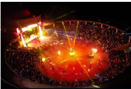
ปาร์ตี้กองไฟยามค่ำ