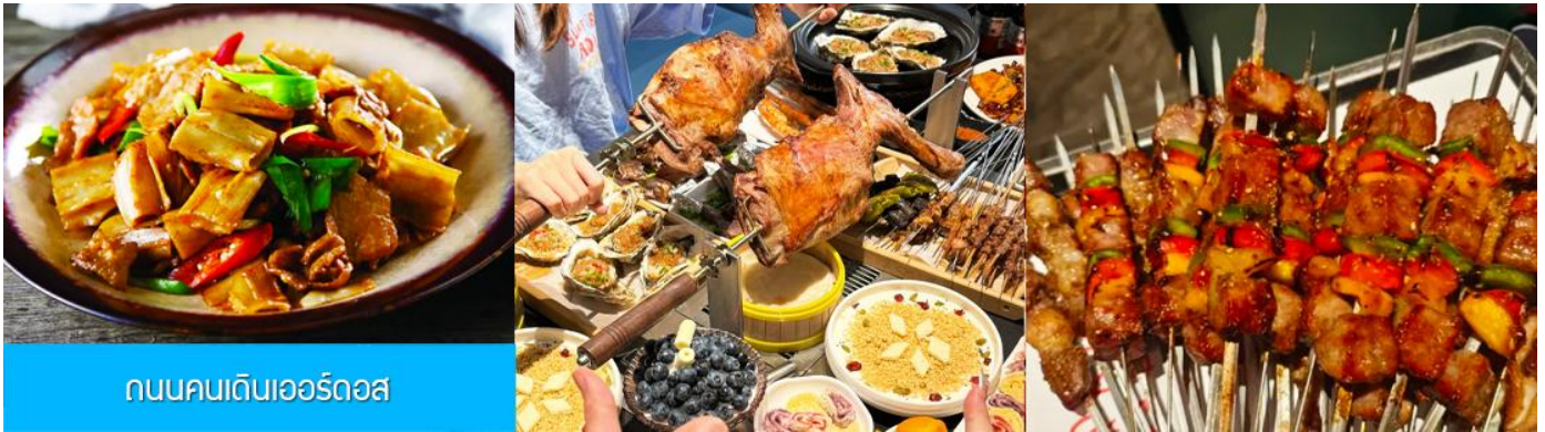
ถนนคนเดินเออร์ดอส

ยิ่งใหญ่เมื่อ 700 ปีก่อน ชม ประตูงเทียน 崇天门 สุคมโหฬารที่แสดงถึงความยิ่งใหญ่ของจักรวรรดิมองโกล ชม จัตุรัสเถิงเก้อหลี่ 腾格里广场 จัตุรัสกลางแจ้งขนาดใหญ่ที่ใช้ประกอบพิธีกรรมต่าง ๆ