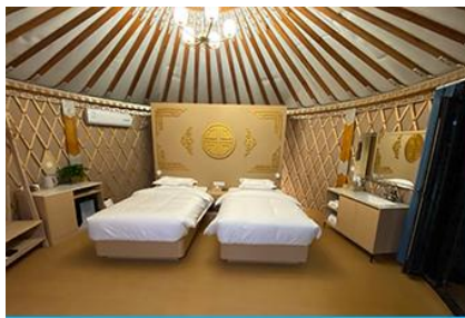
ห้องพักสไตล์มอโกเลียน