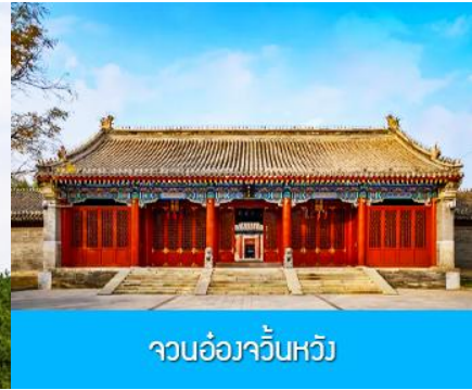
จวนอ๋องจวินหวัง

วันที่หก เมืองเออร์ดอส-อี้เค่ออ่าเป่า-จวนอ๋องจวินหวัง- สวนวัฒนธรรมหมงกู่หยวนหลิว-ซื้อปิ้งถนคนเดิน