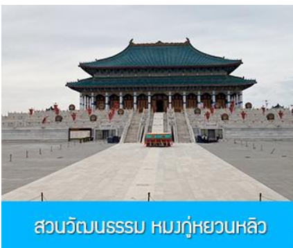
สวนวัฒนธรรม หมงกู่หยวนหลิว

หลังอาหารนำท่าน เที่ยวชม จวนอ๋องจวินหวัง 郡王府 จวนแห่งนี้เริ่มสร้างขึ้นในปี ค.ศ. 1902 สร้างเสร็จในปี ค.ศ. 1936 เป็นที่พำนักของ อ๋องอิฉิจวินหวัง 伊旗郡王 เป็นจวนอ๋องเพียงหนึ่งเดียวที่ได้รับการอนุรักษ์ในสภาพที่สมบูรณ์ โครงสร้างทำด้วยอิฐ หิน และไม้ ประกอบด้วยห้องพัก 16 ห้อง เป็นสถาปัตยกรรมผสมแบบมองโกล ทิเบต และฮั่น