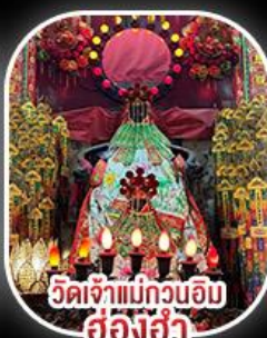
วัดเจ้าแม่กวนอิมสองฮ่า