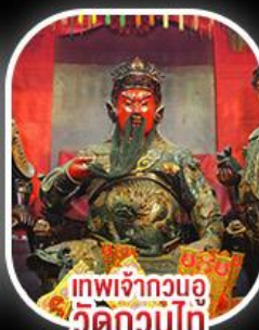
เทพเจ้ากวนอู วัดกวนไท