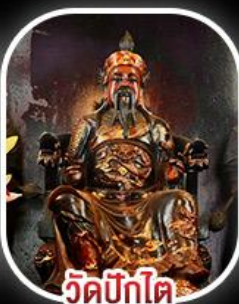
วัดบิกิต