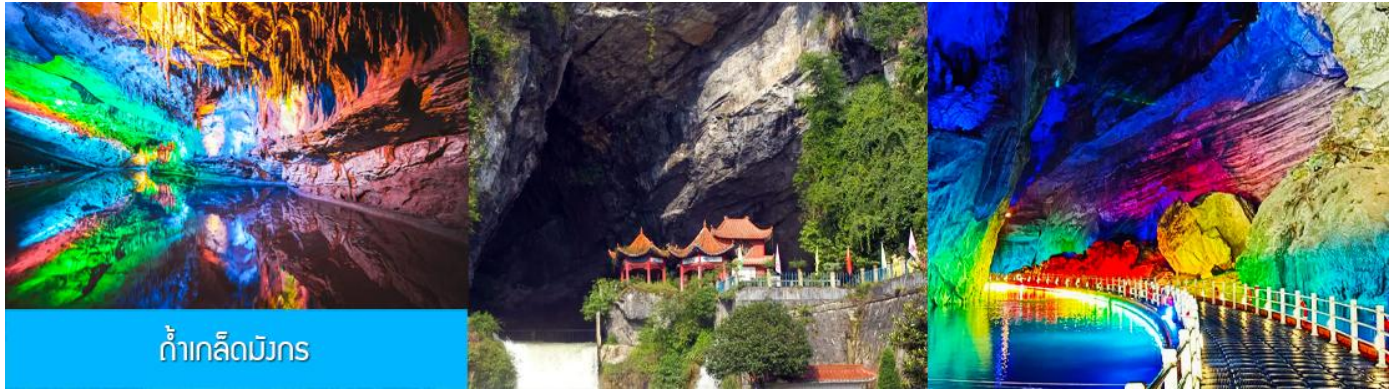
ถ้ำเกล็ดมังกร

พักที่ JINMA HOTEL ระดับ 4 ดาวท้องถิ่นหรือเทียบเท่าในเมืองเซียนเอิน