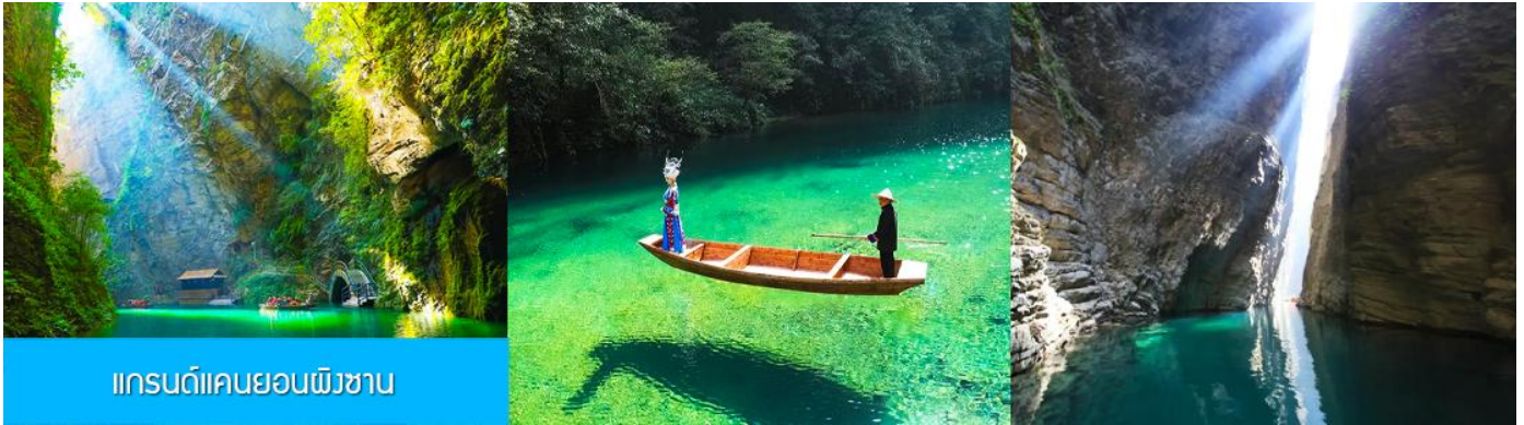
แกรนด์แคนยอนผิงซาน