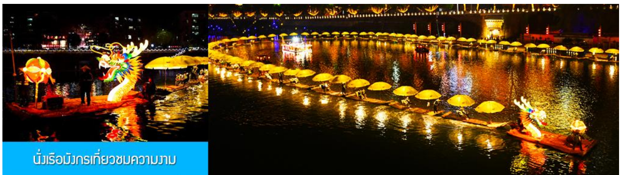
นั่งเรือมังกรเที่ยวชมความงาม