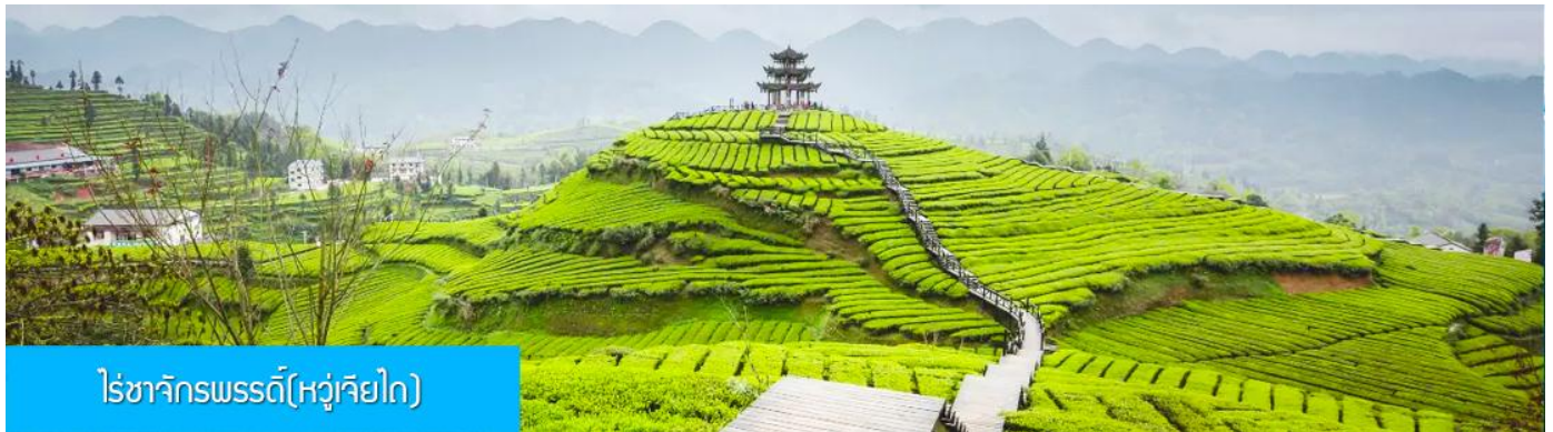
ไร่ชาจักรพรรดิ(หวู่เจียไถ)

พักที่ VIENNA HOTEL ระดับ 4 ดาวท้องถิ่นหรือเทียบเท่าในเมืองเินซือ