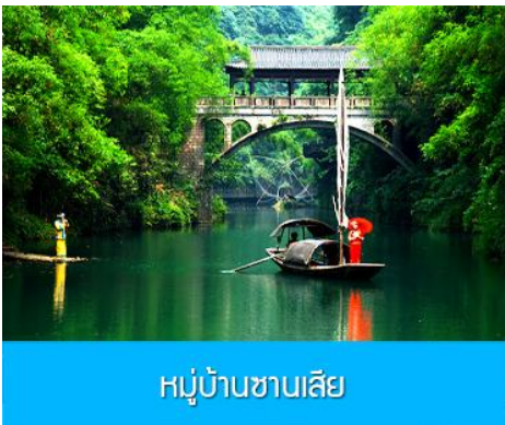
หมู่บ้านชาวลี

พักที่ YICHANG HUIHAO HOTEL โรงแรมระดับ 4 ดาวหรือเทียบเท่าในเมืองหยีซาง