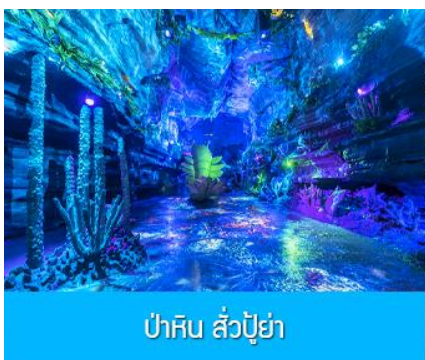
ป่าหิน ลั่วปู้ย่า

เที่ยง รับประทานอาหารกลางวัน ณ ภัตตาคาร (8)