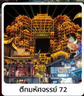
ตึกมหัศจรรย์ 72