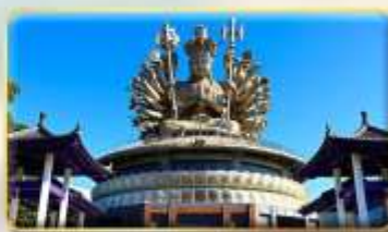
วัดกวงอิมหยวนเต้า