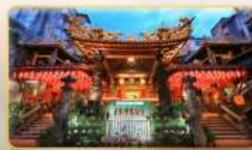
วัดเทียนโฮ่ว จอพรเจ้าแม่หม่าจู