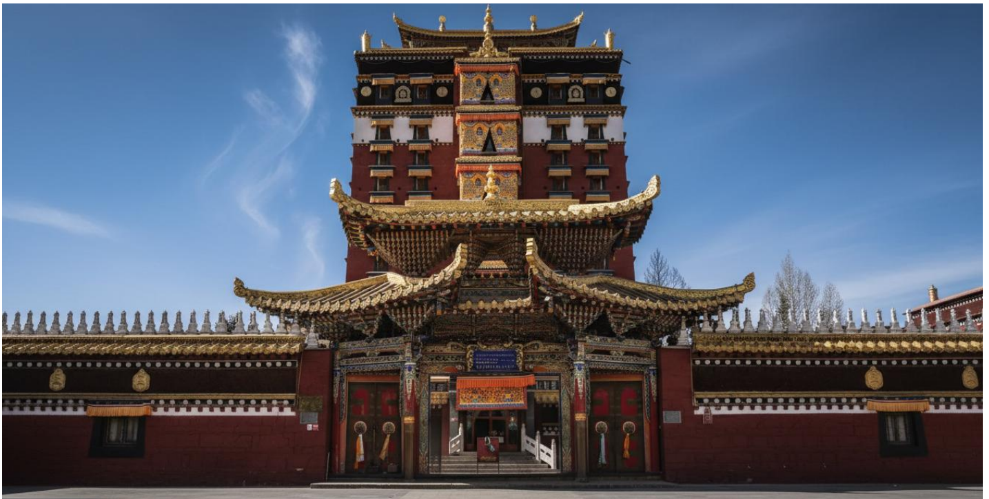
บ่าย นำท่านเดินทางสู่ หอพระมิลारेปะ (ระยะทาง 134 ก.ม. ใช้เวลาเดินทางประมาณ 2 ชั่วโมง) สู่ใจกลางศรัทธา หอพระ 9 ชั้น มิลारेปะ สถาปัตยกรรมทางพุทธศาสนาที่น่าอัศจรรย์ใจและเป็นหนึ่งเดียวใน