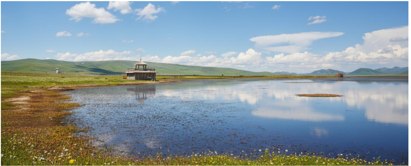
กลางวัน รับประทานอาหารกลางวัน ณ ภัตตาคาร (เมื่อที่ 17)

ขจี อากาศที่นี่บริสุทธิ์และบางเบา มีเพียงเสียงลมที่พัดผ่านยอดหญ้าและเสียงนกน้ำที่ขับขานเป็นท่วงทำนองแห่งธรรมชาติ บรรยากาศอันเงียบสงบจะชะล้างความเหนื่อยล้าให้หมดสิ้นไปในทันที ทะเลสาบแห่งนี้ไม่ได้เป็นเพียงความงดงามทางสายตา แต่ยังเป็นพื้นที่ชุ่มน้ำอันอุดมสมบูรณ์และมีความสำคัญยิ่งต่อระบบนิเวศบนที่ราบสูงทิเบต ถือเป็นแหล่งพักพิงและสวรรค์ของเหล่ากอพยพนานาชนิด โดยเฉพาะอย่างยิ่ง "นกกระเรียนคอดำ" สัตว์ปีกสง่างามอันเป็นสัญลักษณ์แห่งความสุขและอายุยืนยาวในวัฒนธรรมทิเบต ในช่วงฤดูร้อนทุ่งหญ้ารอบทะเลสาบจะผลิดอกไม้ป่านานาพรรณ กลายเป็นภาพวาดสีสันสดใสที่ธรรมชาติรังสรรค์ขึ้น เชิญท่านทอดน่องไปตามสะพานไม้ที่ทอดยาวเหนือผืนน้ำ สูดอากาศอันแสนสดชื่นให้เต็มปอด พร้อมเก็บภาพความประทับใจของผืนน้ำจรดขอบฟ้า ที่ซึ่งฝูงปศุสัตว์ของชาวทิเบตพื้นเมืองกำลังเล็มหญ้าอย่างอิสระอยู่ไกลๆ