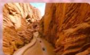
แกรนด์แคนยอนอาวูซือ