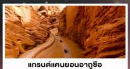
แกรนด์แคนยอนอาถูซื่อ