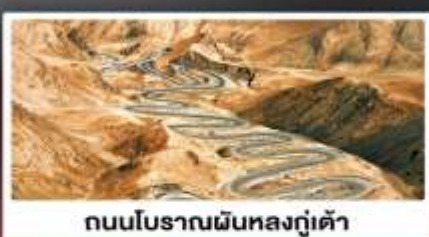
ถนนโบราณผืนหลงกู่เต้า