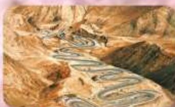
ถนนโบราณผืนหลงกู่ต้า