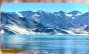
ทะเลสาบไป่ซาหู