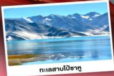
ทะเลสาบโปซาทุ

เปิดประตูสู่อารยธรรมพันปีแห่งซินเจียงใต้ ชมความสวยงามของหมู่บ้านดอกแอปเปิ้ล