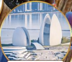
โรงแรมหรูไฮมุก