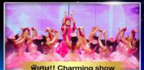
พิเศษ!! Charming show