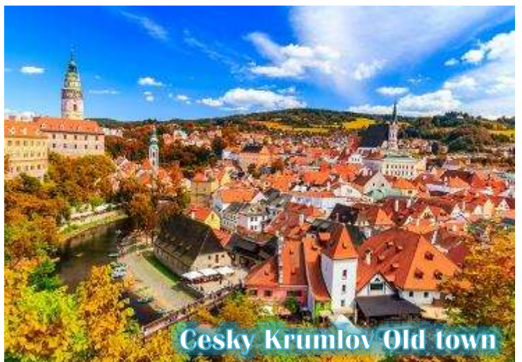
Cesky Krumlov Old town

บ่าย นำท่านเดินทางสู่ “เมืองเชสกี้ คุมลอฟ (เมืองมรดกโลก)” เป็นเมืองขนาดเล็กในภูมิภาคโบฮีเมียใต้ของ สาธารณรัฐเช็กมีชื่อเสียงจากสถาปัตยกรรม และศิลปะของเขตเมืองเก่าและปราสาทครุม ลอฟ ที่ยังคงมีเสน่ห์เหมือนอยู่ในเทพนิยายมา จนถึงทุกวันนี้ และน่าจะเป็นเมืองที่สวยงามที่สุดใน สาธารณรัฐเช็ก, เชสกี้ คุมลอฟได้รับการจัด อันดับให้อยู่ในสิบเมืองที่สวยงามที่สุดในโลก เป็น หนึ่งในสถานที่ที่สวยงามที่สุดและไม่ควรพลาด ในการเดินทางไปสาธารณรัฐเช็ก เดินเล่นไปบน ถนนในยุคกลาง ปราสาทสไตล์บาโรกที่ไม่บุบ สลาย และแม่น้ำที่คดเคี้ยว เมืองเก่าที่งดงามแห่งนี้ได้รับการอนุรักษ์ไว้อย่างดีจากอดีตและการทิ้งระเบิดใน สงครามโลกครั้งที่ 2 ทั้งหมดทำให้เมืองที่มีทิวทัศน์แห่งนี้รู้สึกเหมือนอยู่ในเทพนิยายจากยุคกลางสู่ความเป็นจริง