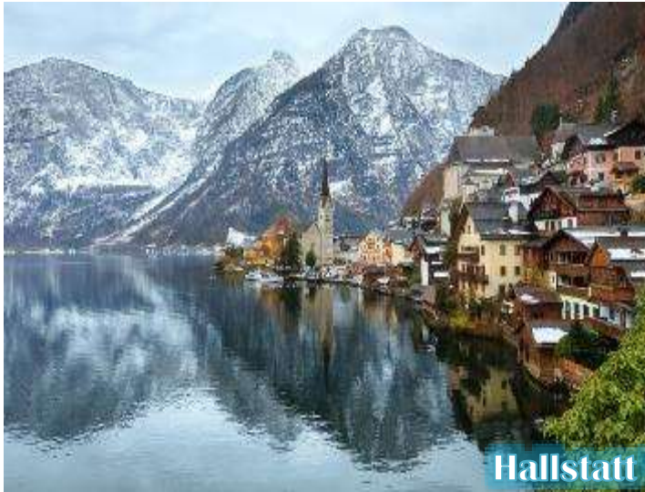
Hallstatt View point

*** บริษัทฯ ขอสงวนสิทธิ์ในการย้ายโรงแรมที่พักไปยังเมืองเซนต์ลูส์เฟิง หรือ เซนต์กิลเกน (ริมทะเลสาบ) แทน ในกรณีโรงแรมในหมู่บ้านฮัลล์สตัดท์เต็ม ***