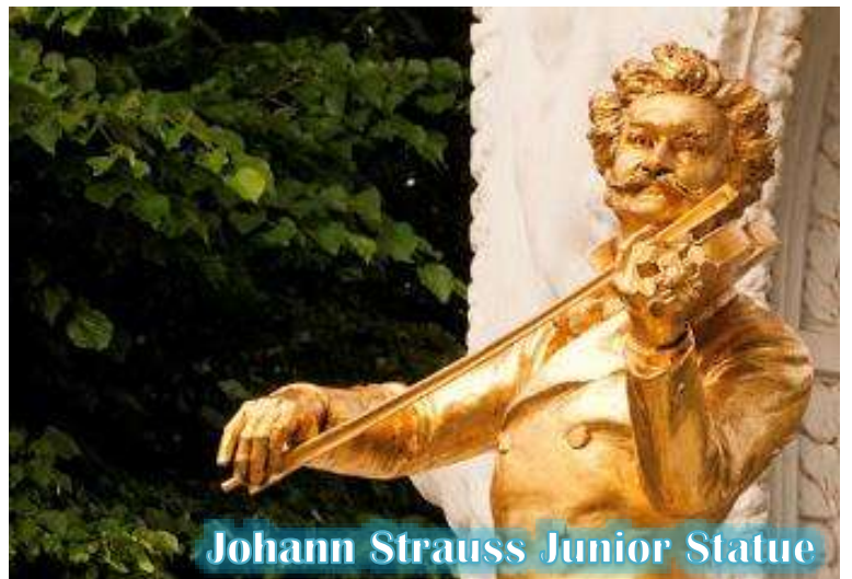
Johann Strauss Junior Statue

เช้า บริการอาหารเช้า ณ ห้องอาหารของโรงแรม นำท่านออกเดินทางเข้าสู่ใจกลาง “กรุง เวียนนา” (Vienna) ผ่าน “ถนนวงแหวน” Ring Strasse ซึ่งเป็นที่ตั้งของ โรง อوبرาการ์ (โอเปร่าเฮาส์), พระราชวังฮอฟบวร์ก, อาคาร รัฐสภา, ศาลาว่าการ, มหาวิทยาลัยเวียนนา, โบสถ์ประจำเมือง, ศาลสูง ฯลฯ เดินทางสู่ “สวนสาธารณะสตัดปาร์ค” สวนสาธารณะอัน ร่มรื่นใจกลางเมือง ชม “ อนุสาวรีย์ โยฮัน สเต ร้าวส์ จูเนียร์ ” Johann Strauss ศิลปินที่มี ชื่อเสียงก้องโลก