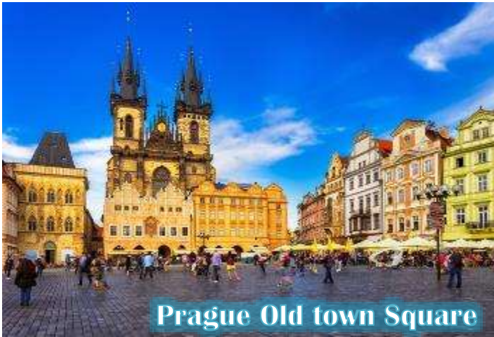
Prague Old town Square