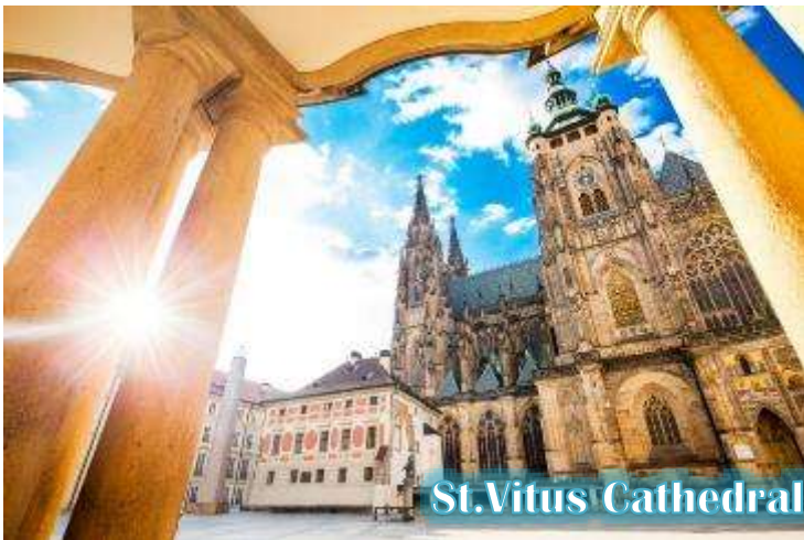
St. Vitus Cathedral