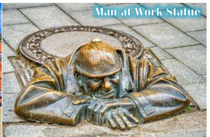
Man at Work Statue