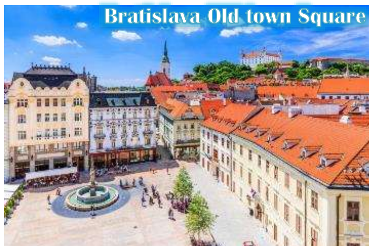
Bratislava Old town Square

บ่าย นำท่านเดินทางสู่กรุงบราติสลาวา, ประเทศสโลวัก นำท่านเข้าชมเมืองเก่าบราติสลาวา สัมผัสบรรยากาศเมืองเก่า และถ่ายภาพกับโรงละครโอเปร่า สัญลักษณ์แห่งความหรรษาของประเทศ และเก็บภาพรูปปั้นที่ซ่อนอยู่ในตัวเมือง ไม่ว่าจะเป็นรูปปั้นโปเลียนหน้าสถานทูตฝรั่งเศส หรือรูปปั้นปาปาริซซ์รวมถึง ไฮไลต์ของเมืองคือรูปปั้นของคนที่ตกท่อคูมิล” (Man at Work) ที่โด่งดัง ณ แห่งนี้เคยถูกรถชนมาแล้วถึง 2 ครั้ง ในปัจจุบันจึงมีป้าย เขียนว่า “Man at Work” ปักอยู่บริเวณดังกล่าว เป็นสัญลักษณ์ช่วงที่เป็นคอมมิวนิสต์ และตำนานยังคงเล่าต่อไปว่าอาจจะเป็นคุณลุงที่เหน็ดเหนื่อยกับการทำงานอยากจะพักผ่อนบ้างตามประสานักงานหนัก จากนั้นนำท่านชม “ประตูไมเคิล” ซึ่งซุ้มประตูไมเคิลก่อสร้างสไตล์โกธิคสูง 51 เมตร มีอยู่ทั้งหมด 4 แห่ง ปัจจุบันเป็น ประตูเพียงแห่งเดียวที่ยังเหลืออยู่ ประตูไมเคิลมียอดโดมทรงหัวหอมตามศิลปะบารอก 3 ชั้น ลดหลั่นกัน ประตูแห่งนี้ตั้งอย่างศูนย์กลางเมืองเก่า สองฝั่งถนนมีอาคารเก่าแก่หลาก สี สัน สไตล์อาร์ตนูโวตั้งเรียงรายอยู่ทำให้บรรยากาศคึกคัก