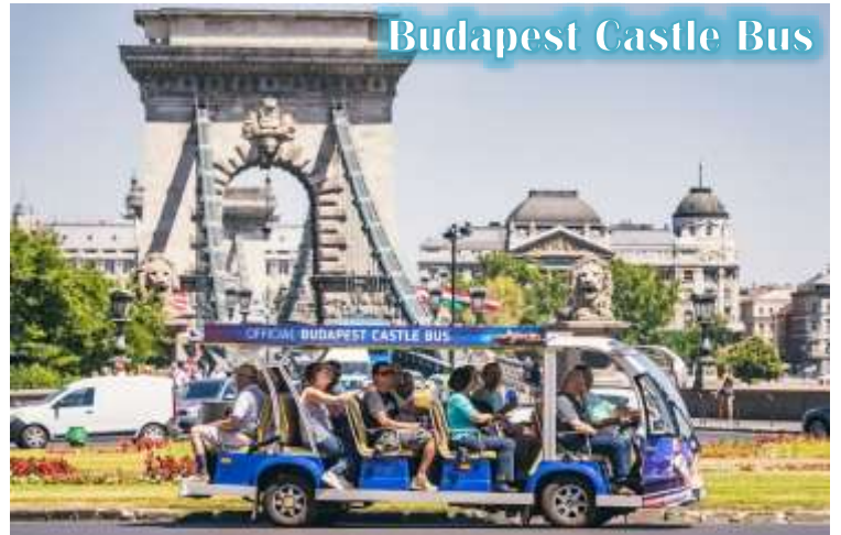
Budapest Castle Bus

บูดา Castle Hill *เนื่องจากตัวปราสาทตั้งอยู่บนเนินเขา การเดินทางโดยรถไฟไฟฟ้า จะเพิ่มความสะดวกสบายให้กับท่าน โดยรถไฟไฟฟ้าจะจอดรับและส่งตามจุดต่างๆ ในย่านเมืองเก่า ไม่ต้องเดินเท้าเป็นระยะทางไกล* จากนั้นนำท่านเดินชมความงดงามของเมืองเก่ารอบๆปราสาทบูดา ที่เริ่มมีการก่อสร้างมาตั้งแต่ปี ค.ศ.1265 และต่อเติมปรับปรุงมาโดยตลอด จนกระทั่งปัจจุบัน โดยตัวอาคารในปัจจุบันเราจะเห็นเป็นสไตล์บาโรก ที่ดู