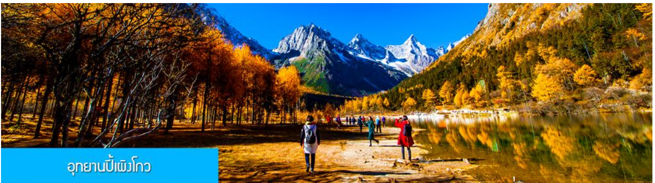
อุทยานเป่ย์เฟิงโกว