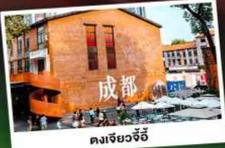
ตงเจียวจี้