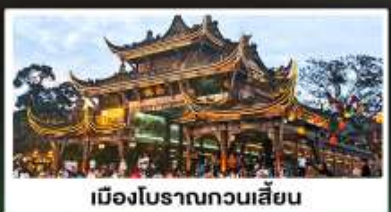
เมืองโบราณกวนเสียน