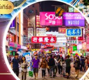
Shopping Tsim Sha Tsui