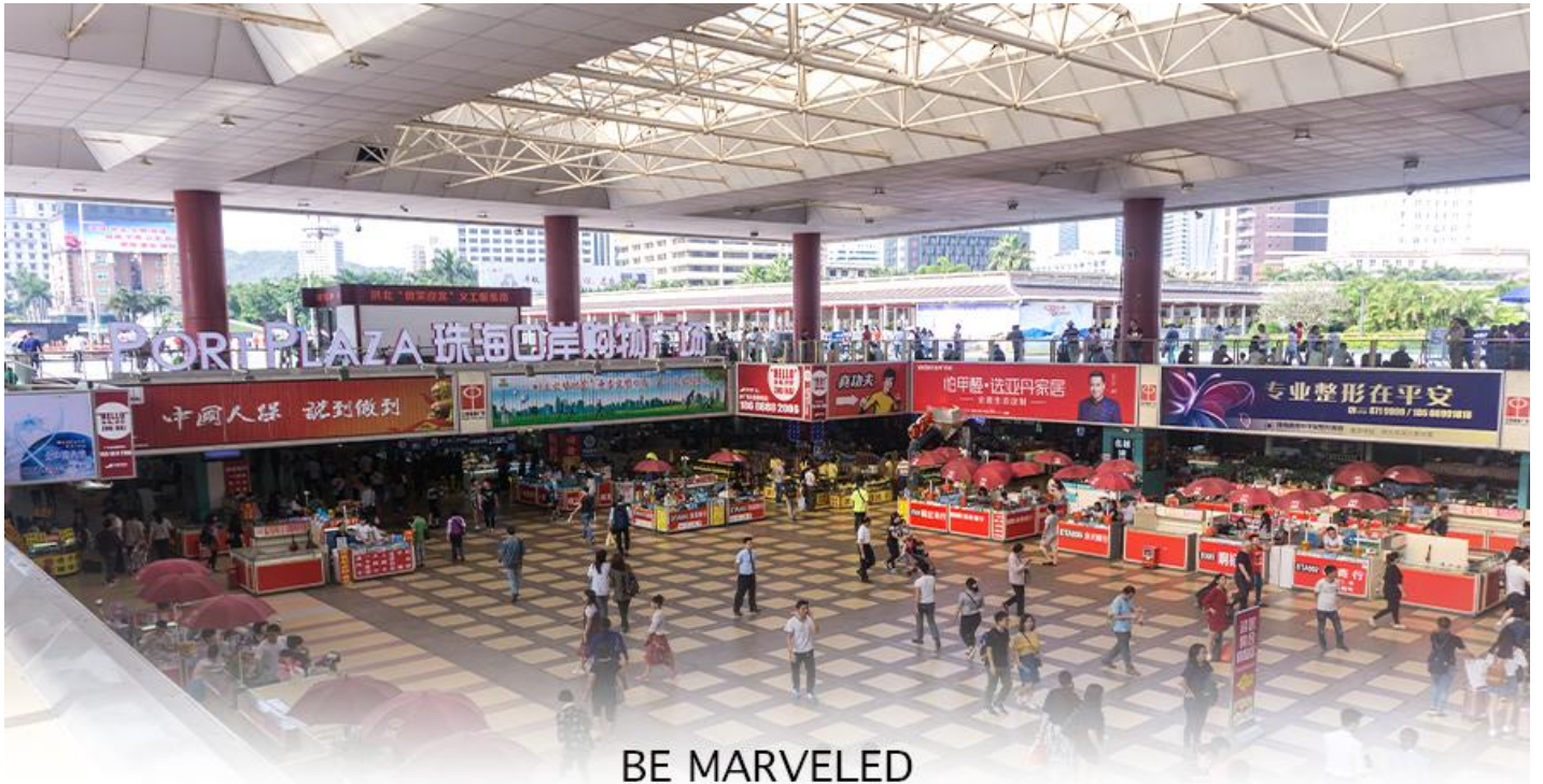
BE MARVELED ตลาดใต้ดิน กวเป่ย์

📍 อิสระอาหารอาหารเย็นตามอัธยาศัย **เพื่อความสะดวกในการซื้อปิ้ง**