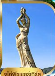
จูไห่ฟิชชอร์ทิวรา