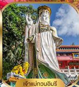
เจ้าแม่กวนอิม พลัสเบย์