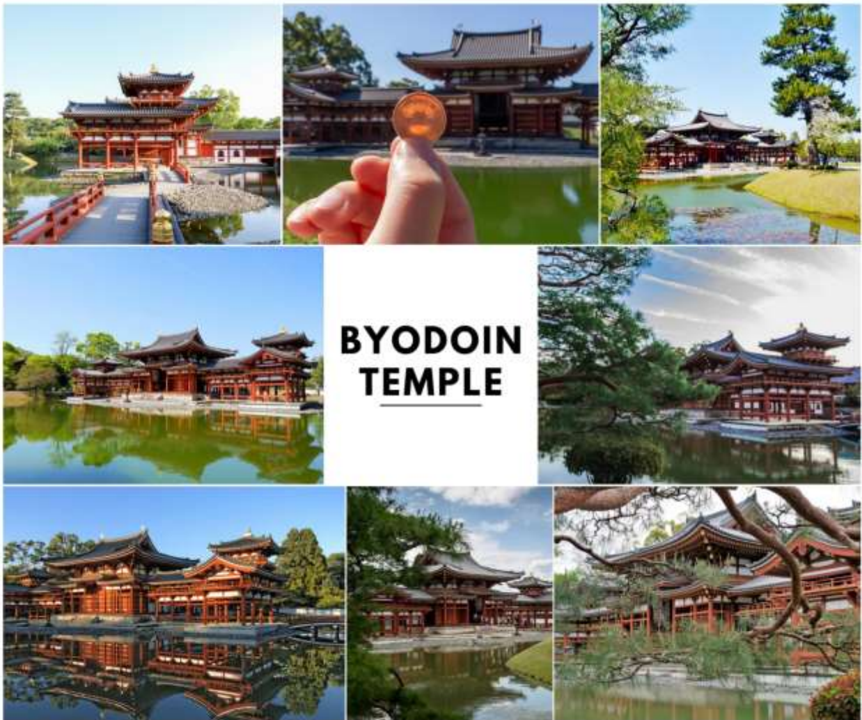
รูปภาพใช้เพื่อประกอบการโฆษณาเท่านั้น

จากนั้นนำท่านเดินทางสู่ จังหวัดเกียวโต (Kyoto) เคยเป็นเมืองหลวงของประเทศญี่ปุ่นในอดีตร่วมกว่า 1,100 ปี จึงทำให้มีสถานที่สำคัญหลากหลายแห่ง ซึ่งเต็มไปด้วยประวัติศาสตร์ และวัฒนธรรมดั้งเดิมของญี่ปุ่นมากมาย เพื่อนำท่านสู่ เมืองอูจิ (Uji) ตั้งอยู่ในจังหวัดเกียวโต เป็นเมืองเล็ก ๆ ที่ขึ้นชื่อเรื่องชาเขียวมัทฉะคุณภาพเยี่ยมระดับต้น ๆ ของญี่ปุ่น บรรยากาศเงียบสงบ เหมาะแก่การท่องเที่ยวเชิงวัฒนธรรม และพักผ่อน ไฮไลท์สำคัญ คือ มรดกโลก วัดเบียวโดอิน ที่ปรากฏบนเหรียญ 10 เยน และเป็นเมืองแห่งชาเขียวที่มีดาเฟ้ และร้านชาเปิดบริการมากมาย นำท่านสู่ วัดเบียวโดอิน (Byodoin) เป็นวัดเก่าแก่สมัยเฮอัน (ค.ศ. 1052) ที่ได้รับการขึ้นทะเบียนเป็นมรดกโลกของยูเนสโก ส่วนหนึ่งของอนุสรณ์สถานทางประวัติศาสตร์เกียวโตโบราณ จุดเด่นที่สุด คือ วิหารฟินิกซ์ (Phoenix Hall) ซึ่งเป็นอาคารไม้ดั้งเดิมที่เหลืออยู่เพียงแห่งเดียว โดยมีรูปทรงคล้ายนกฟีนิกซ์กำลังกางปีก และเป็นรูปที่ปรากฏอยู่บนเหรียญ 10 เยนของญี่ปุ่นด้วย ภายในประดิษฐานพระพุทธรูปพระอมิตาภะ (Amida Buddha) และมีพิพิธภัณฑ์โฮโซดงที่จัดแสดงสมบัติของชาติมากมาย (ราคาทัวร์ไม่รวมค่าเข้า) ใช้เวลาเดินทางประมาณ 40 นาที