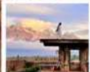
YUN DI AN CAFE