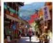
หมู่บ้านป๊ายา