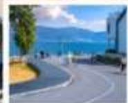
โถง 5 ทะเลสาบเอ๋อไห่