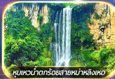
หุบเขาน้ำตกร้อยสายหม่าหลิงเหอ