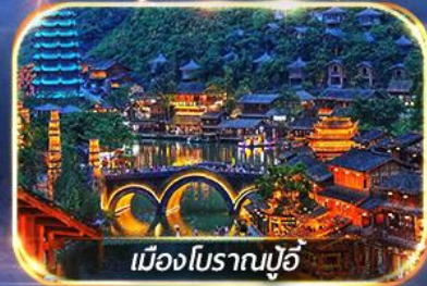
เมืองโบราณปู้จี้

สัมผัสบรรยากาศสุดโรแมนติก ณ หมู่บ้านปู้จี้ & ป่ากุเขามันหยอด เดินเล่น Wenlin Street ชมต้นแปะก๊วย & ถนนสายคาเฟ่สุดฮิต