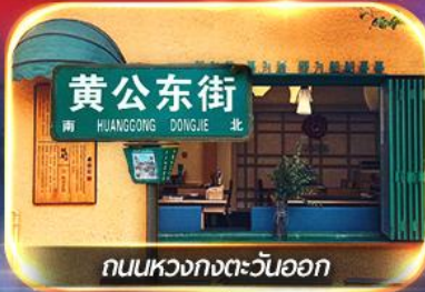
ถนนหวงกงตะวันออก