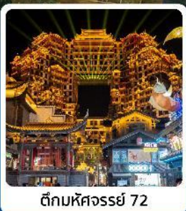
ตึกหอคจรรย 72