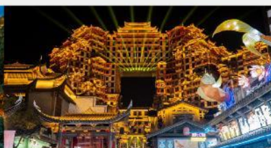
ตีทมห้ศจสรย์ 72