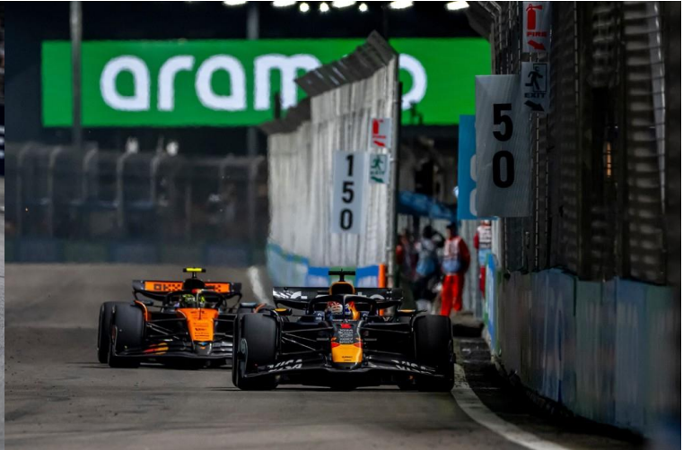
ชม รอบ SPRINT RACE + QUALIFYING