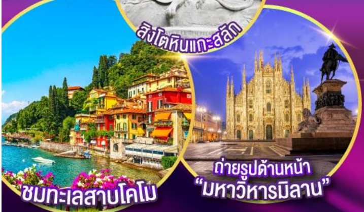
ชมทะเลสาบโคโม