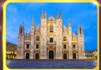
มหาวิหารแห่งเมืองมิลาน