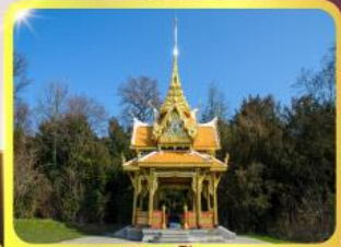
ศาลาไทยไชยาน์

GO3CDG-TG058 • ชมมหาวิหารแห่งเมืองมิลาน 8 วัน | 5 คืน