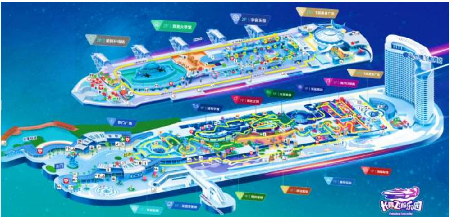
แผนที่ CHIMELONG SPACESHIP PARK