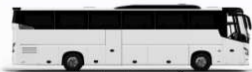
ตัวอย่างรูปภาพรถ 1 ชั้น