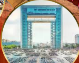
ประตูแห่งความสุข