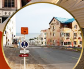
ถนนฮ้างวีป่า