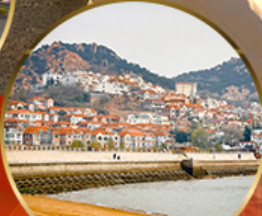
ซาจื่อเป่