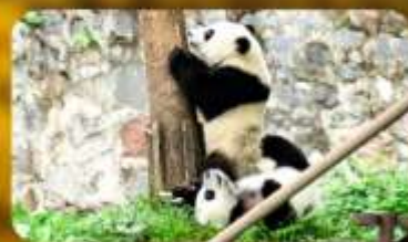
ศูนย์หมิวแพนด้า