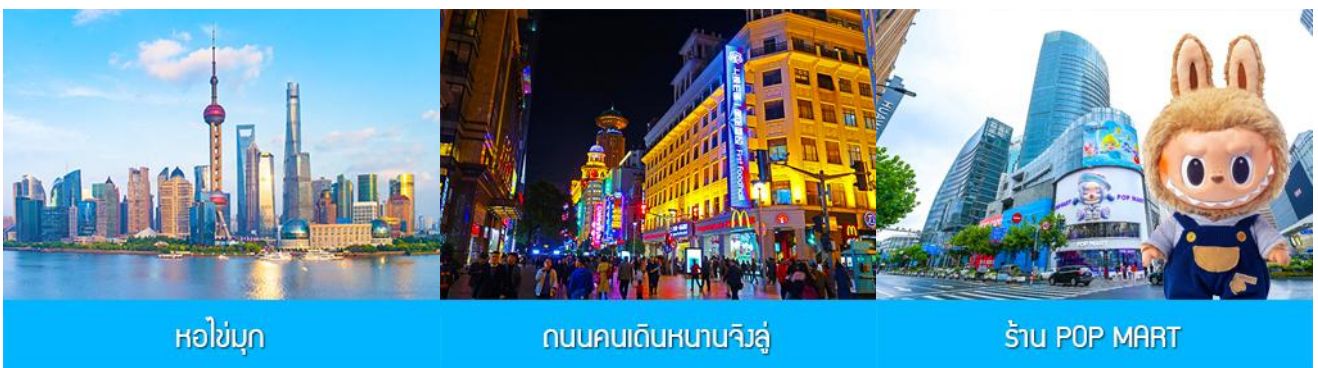
หอไข่มุก