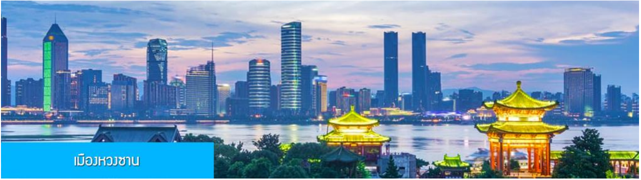
เมืองหวงซาน