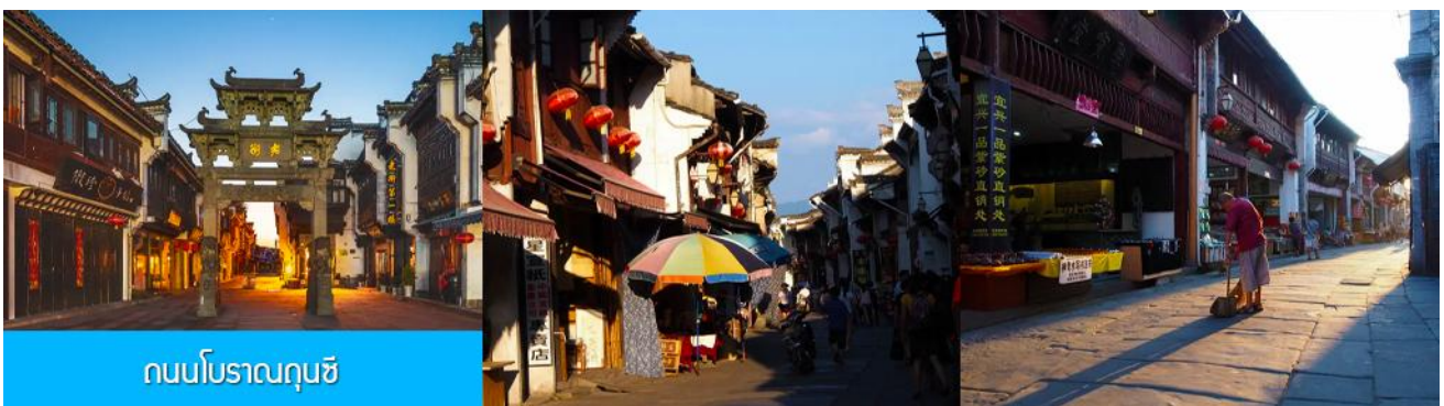
ถนนโบราณฉุนซี

อิสระอาหารมื้อกลางวัน ( ท่านสามารถเลือกชิมอาหารพื้นเมืองในระแวกโรงแรมได้ตามอัชชาศัย )