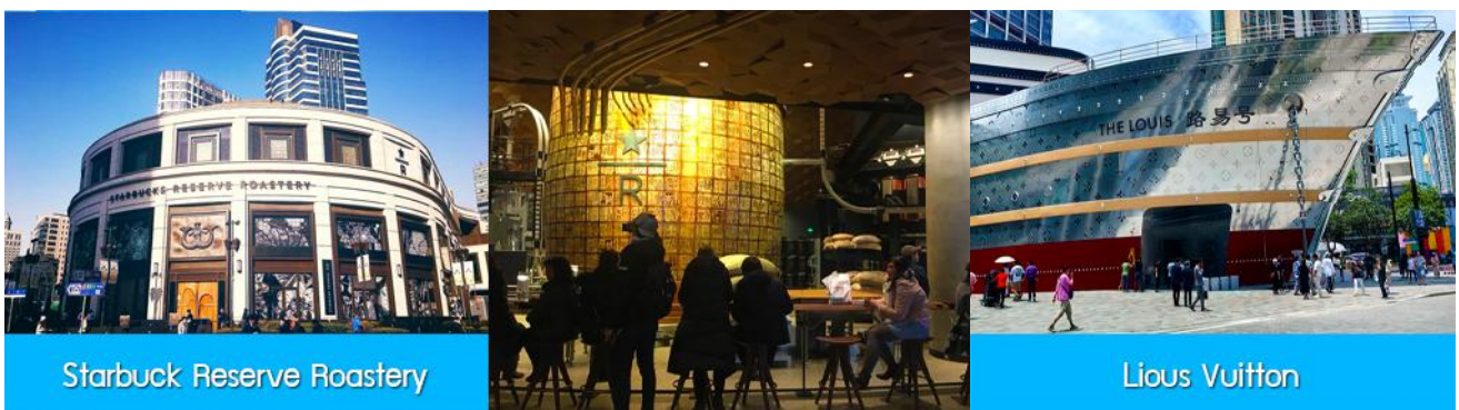
Starbuck Reserve Roastery