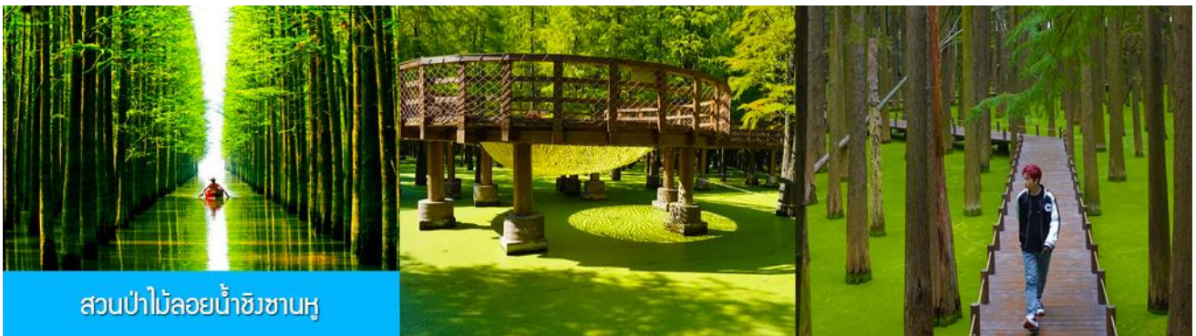
สวนป่าไม้ลอยน้ำชิงซานหู

หลังอาหารเช้าท่านเดินทางโดยรถบัสสู่เมืองหลิงอัน 临安市 (ระยะทาง 175 กม. ใช้เวลาเดินทางราว 2 ชั่วโมงเศษ)