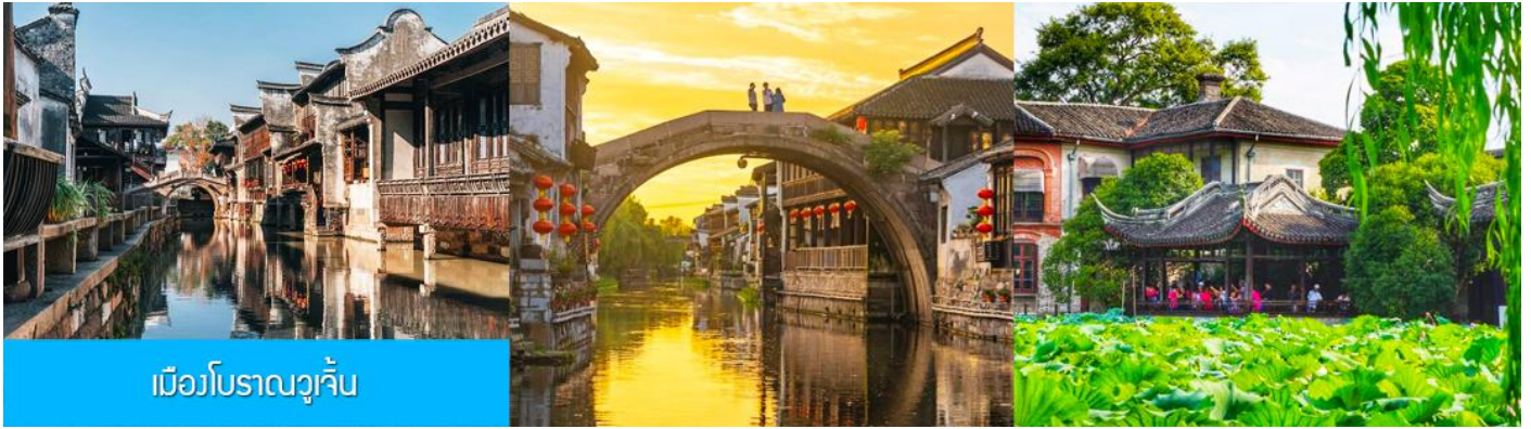
เมืองโบราณวูเจิ้น