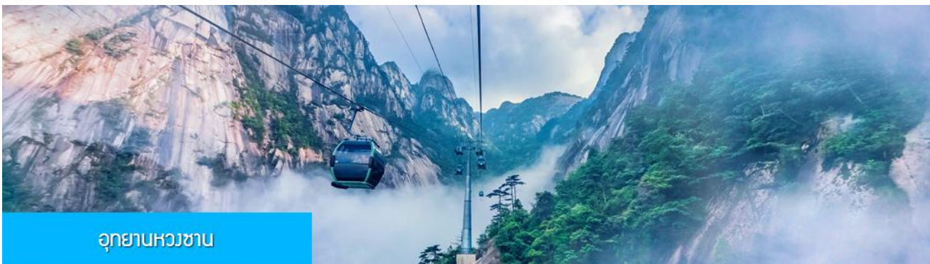
อุทยานหวงซาน