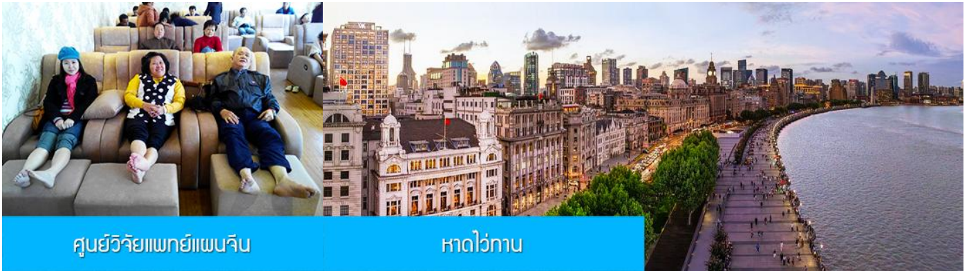
ศูนย์วิจัยแพทยแผนจีน