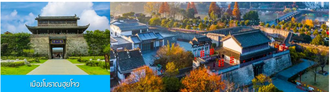
เมืองโบราณฮุยโจว

หลังอาหารนำท่านเที่ยวชม เมืองโบราณฮุยโจว 徽州古城 แหล่งท่องเที่ยวระดับ 5A และเป็นหนึ่งในสี่เมืองโบราณที่คงสภาพสมบูรณ์และมีขนาดใหญ่ที่สุดของจีน ตั้งอยู่ในอำเภอเซ่อเจี๋ยน มณฑลอันฮุย เมืองโบราณ