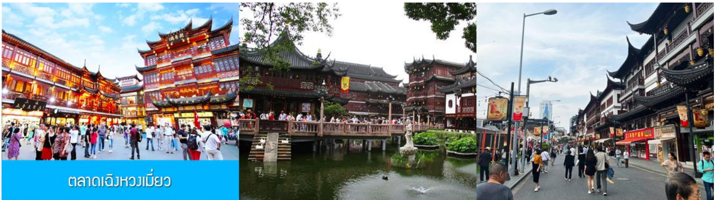
ตลาดเจิงหวงเมี่ยว

เช้า รับประทานอาหารเช้า ณ ห้องอาหารของโรงแรม (6)