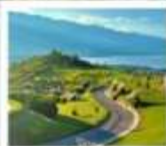
ภูเขาอวี่นเซียงชาน