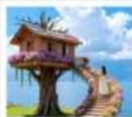
หมู่บ้านเหวินปี้