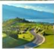
กุซ่าววันเซียงซาน