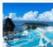
ซานโตรีนต้าหลี่