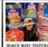
SNACK BUSY STATION