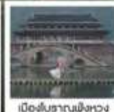
เมืองโบราณผิงหวง