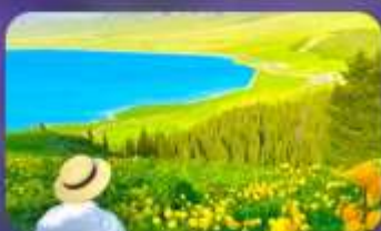
ทะเลสาบไซ่หลี่มู่