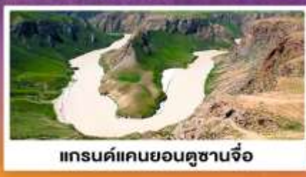
แกรนด์แคนยอนคูซานจื่อ