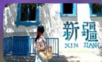
ถนนคนเดินหลิวซิงเจียง