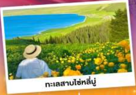
ทะเลสาบโซหลี่มู่

ถ่ายรูปทุ่งดอกลาเวนเดอร์ - กุ่มหญ้าคาลาจั้น SKY GRASSLAND กุ่มหญ้ามรดกโลก