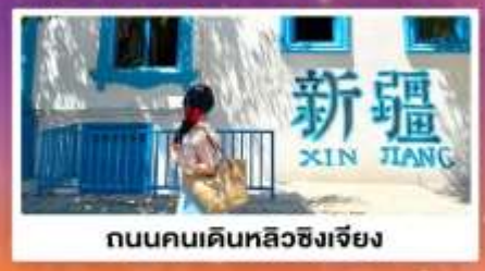
ถนนคนเดินหลิวซิงเจียง