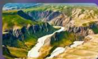
แกรนด์แคนยอนคูซานจื่อ