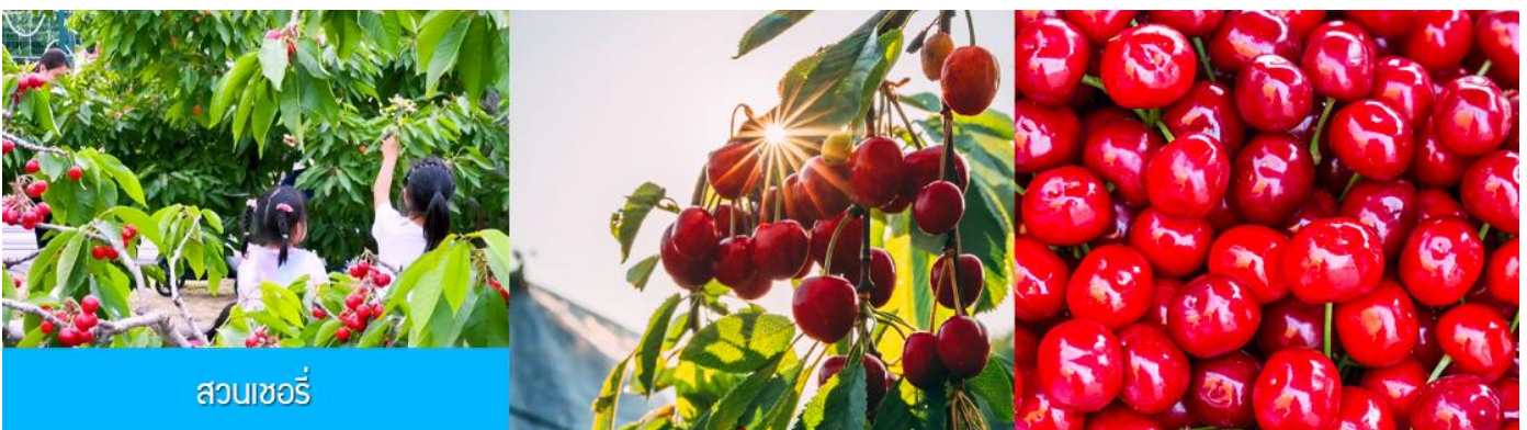
สวนเชอร์รี่

นำท่านสู่ สวนเชอร์รี่ 樱桃园现摘樱桃 ให้ท่านสัมผัสประสบการณ์สุดชิล ด้วยการเด็ดเชอร์รี่สดจากต้นภายในสวนเชอร์รี่ (เชอร์รี่จะของเมืองนี้จะเริ่มสุกและเก็บได้ในช่วงปลายเดือนพฤษภาคม - มิถุนายนของทุกปี ในกรณีที่ผลเชอร์รี่น้อยหรือหมดเร็วกว่าปกติ ทางทัวร์ขอสงวนสิทธิ์ในการจัดโปรแกรมอื่นแทนการเด็ดเชอร์รี่)