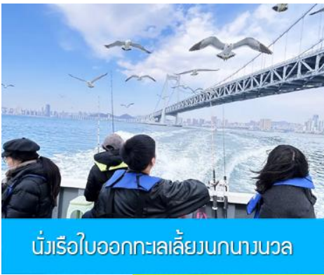
นั่งเรือใบออกทะเลลิ้นกนางนวล

ต่อด้วยนำท่านเที่ยวชมถนนรัสเซีย 俄罗斯风情街 ในอดีตที่นี่เป็นศูนย์ที่ตั้งของที่ทำการเมืองต้าเหลียน ภายหลังได้กลายเป็นชุมชนของพ่อค้าและวิศวกรทางรถไฟชาวรัสเซีย บริเวณนี้จึงเต็มไปด้วยอาคารบ้านเรือนแบบตะวันตก(รัสเซีย) มากมาย นอกจากนี้ได้เก็บภาพที่มีพื้นหลังเป็นอาคารสถาปัตยกรรมตะวันตก ที่นี้ยังมีร้านค้าที่จำหน่ายสินค้าและของที่ระลึกที่นำเข้ามาจากรัสเซีย อาทิ ช็อกโกแลต เหล้าวอดก้า ตุ๊กตารัสเซีย ฯลฯ