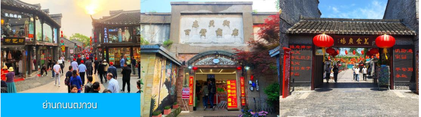
ย่านถนนตงกวน

ชม จัตุรัสชิงไห่ 星海广场 เป็นจัตุรัสขนาดใหญ่เป็นแลนด์มาร์คสำคัญของเมืองต้าเหลียน สร้างขึ้นเพื่อเฉลิมฉลองในโอกาสที่รัฐบาลอังกฤษคืนเกาะฮ่องกงในให้จีนในปี ค.ศ. 1997 ตั้งอยู่ชายฝั่งทะเลในเมืองต้าเหลียน เป็นจัตุรัสใจกลางเมืองที่ใหญ่ที่สุดในโลกและ เป็นแลนด์มาร์คของเมืองต้าเหลียน รายล้อมด้วยตึกระฟ้าที่ทันสมัย ภายในมีบ่อน้ำพุดนตรี ลานหญ้าขนาดใหญ่ และลานกว้างสำหรับจัดกิจกรรมกลางแจ้ง อาทิ เทศกาลเบียร์นานาชาติ การแข่งขันวิ่งมาราธอน งานแฟชั่นนานาชาติเมืองต้าเหลียน ฯลฯ