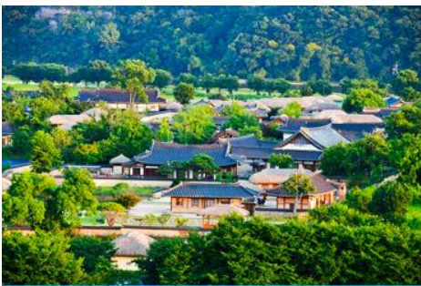
ศูนย์วัฒนธรรมเกาหลี

เช้า รับประทานอาหารเช้า ณ ห้องอาหารของโรงแรม (6)