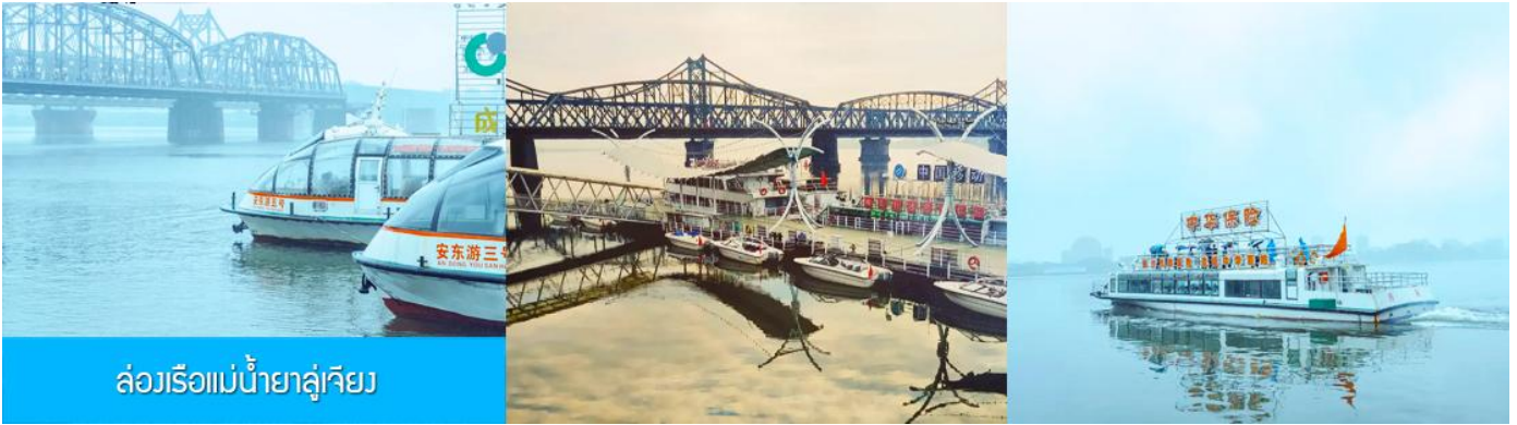
ล่องเรือแม่น้ำยาลู่เจียง

หลังอาหารให้ท่านพักผ่อนตามอัชชาศัยในโรงแรม