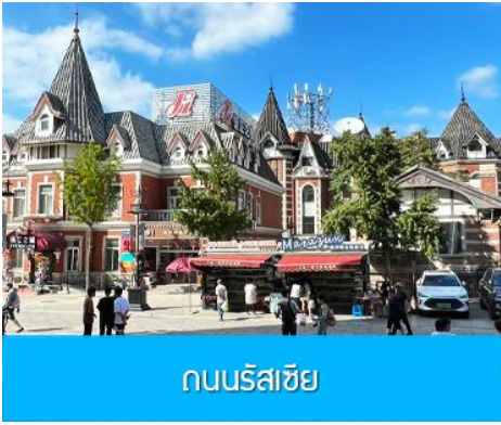
ถนนรัสเซีย