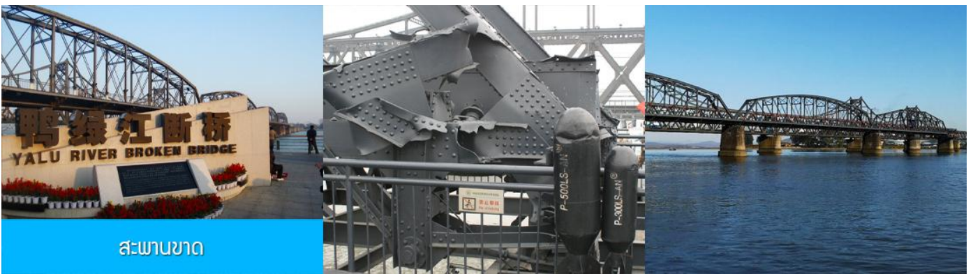
สะพานขาด