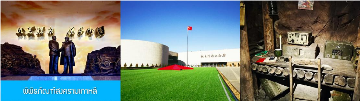
พิพิธภัณฑ์สงครามเกาหลี