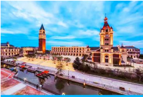
เมืองเวนิสตะวันออก