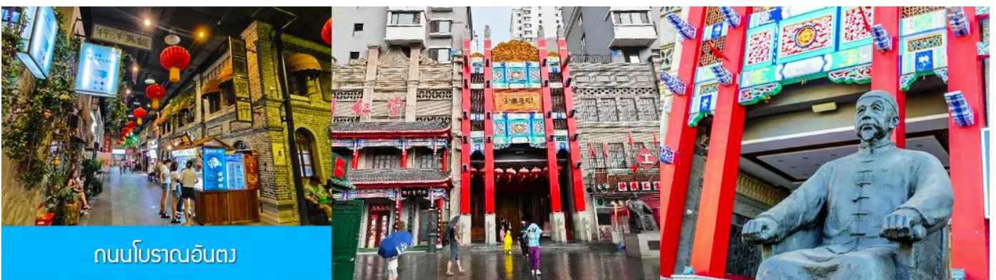
ถนนโบราณอันตง