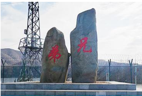
ป้ายพรมแดนจีนเกาหลีและแท่งศิลาสองพี่น้อง