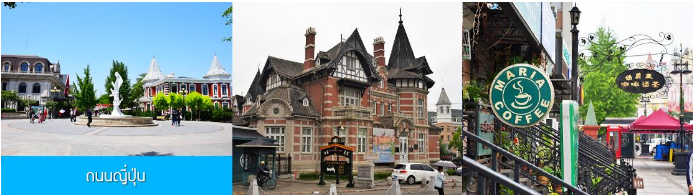
ถนนญี่ปุ่น