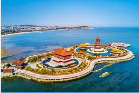
อุทยานทงเกี้ยวแปดเซียนข้ามทะเล