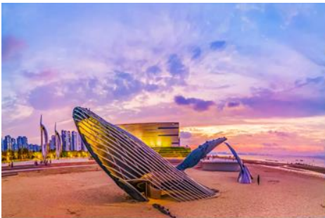
ประติมากรรม วาฬโดดเดี่ยว

จากนั้นนำท่านเดินทางสู่ เมืองเยียนไถ 烟台 (ระยะทาง 85 กม.ใช้เวลาเดินทางราว 1 ชั่วโมงเศษ)