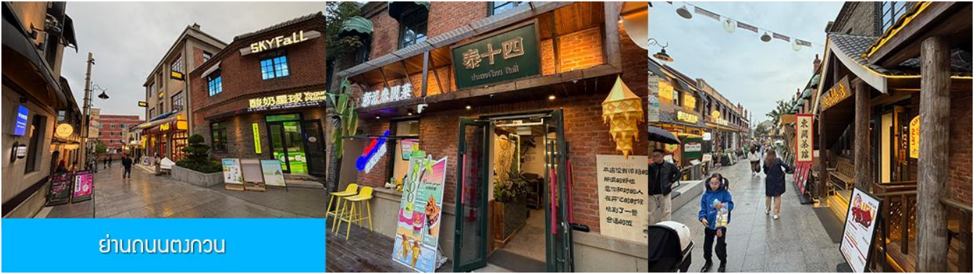
ย่านถนนตวงกวน