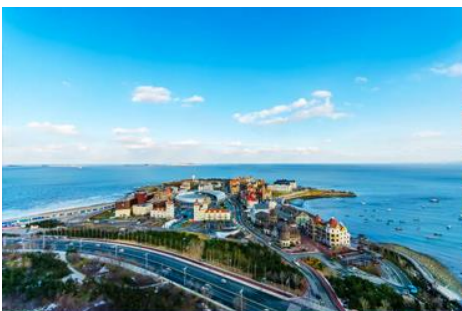
ท่าเรือชาวประมงไห่ซาง