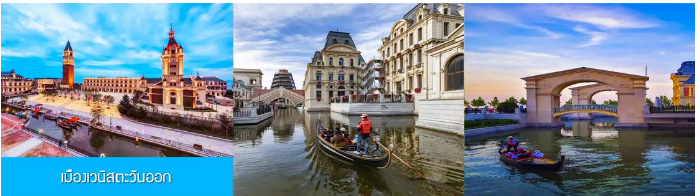
เมืองเวนิสตะวันออก

จากนั้นนำท่านเที่ยวชม เมืองเวนิสตะวันออก 大连东方威尼斯城 เป็นเมืองเวนิสจำลองที่ถูกสร้างขึ้นด้วยทุนกว่า 8,000 ล้านบาท ออกแบบโดยบริษัท ARC จากประเทศฝรั่งเศส โดยจำลองผังเมืองเวนิสในประเทศอิตาลี