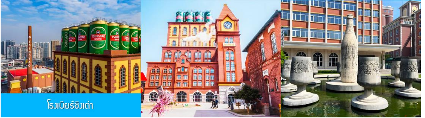
โรงเบียร์ชิงเต่า

จากนั้นนำท่านเที่ยวชม โรงเบียร์ชิงเต่า 青岛啤酒博物馆 พิพิธภัณฑ์เบียร์ที่ขึ้นชื่อของเมืองชิงเต่า ซึ่งเป็นเบียร์ยี่ห้อแรกที่ผลิตขึ้นในประเทศจีน ชมเบียร์ คอลเลกชั่นที่มียี่ห้อหลากหลายที่สุดของโลก และชมการจัดแสดงภาพและวิดิทัศน์เกี่ยวกับวิวัฒนาการของเบียร์ ขั้นตอนการผลิตและอื่น ๆ ที่เกี่ยวข้อง พร้อมชิมเบียร์ชิงเต่า ซึ่งเป็นเบียร์ที่ขายดีที่สุดในยี่ห้อหนึ่งของจีน.. (ชิมเบียร์ชิงเต่าท่านละ 1 แก้ว รับกลับอีก 1 ขวดเล็ก ตอนเดินออก)