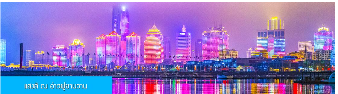
แอสสิ ณ อ่าวฟู่ซานวาว

ค่ำ รับประทานอาหารค่ำ ณ ภัตตาคาร *เมนูซีฟู้ด (3)