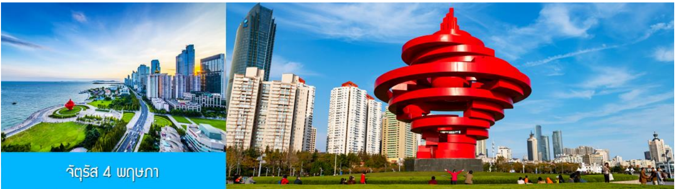
จัตุรัส 4 พฤษภาคม

จากนั้นนำท่านเที่ยวชม โรงเบียร์ชิงเต่า 青岛啤酒博物馆 พิพิธภัณฑ์เบียร์ที่ขึ้นชื่อของเมืองชิงเต่า ซึ่งเป็นเบียร์ยี่ห้อแรกที่ผลิตขึ้นในประเทศจีน ชมเบียร์ คอลเลกชั่นที่มียี่ห้อหลากหลายที่สุดของโลก และชมการจัดแสดงภาพและวิดิทัศน์เกี่ยวกับวิวัฒนาการของเบียร์ ขั้นตอนการผลิตและอื่น ๆ ที่เกี่ยวข้อง พร้อมชิมเบียร์ชิงเต่า ซึ่งเป็นเบียร์ที่ขายดีที่สุดในยี่ห้อหนึ่งของจีน.. (ชิมเบียร์ชิงเต่าท่านละ 1 แก้ว รับกลับอีก 1 ขวดเล็ก ตอนเดินออก)