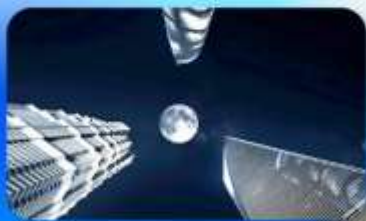
ลู่อิจยส์