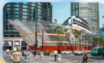
เรือทลยส์วิตคอง