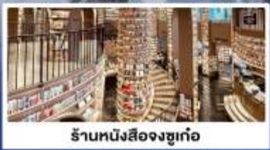
ร้านหนังสือจงซูเก้อ