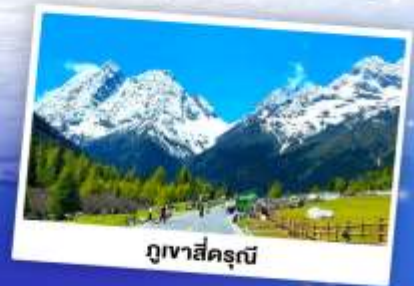
ภูเขาสีครุณี