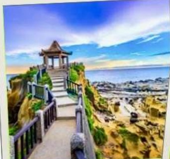
อุทยานเกาะเหอผิง