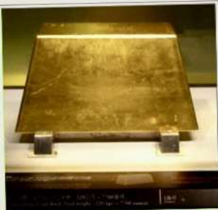
พิพิธภัณฑ์ทองคำ