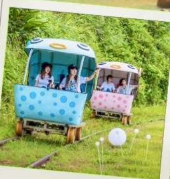
Shen'ao Rail Bike