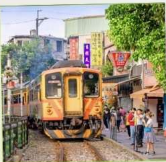
สถานีรถไฟซือเฟิ่น