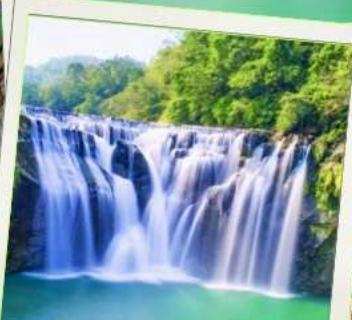
น้ำตกซือเฟิ่น