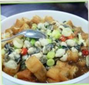
ถนนโบราณซือเฟิ่น