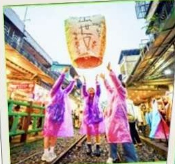
ปล่อยโคมลอย