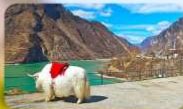
กะเลสาบเต๋อซี