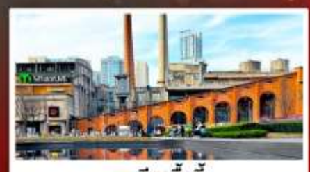
ตงเจียวจ้ออ๊