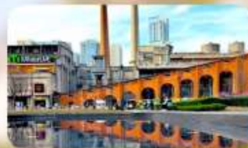
ตงเจียวจื่ออี้