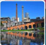
Eastern Suburb Memory Chengdu