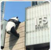
แพนด้ายักษ์ปีนตึกIFS