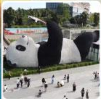
รูปปั้นแพนด้าเซลฟี่