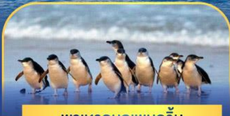
พาเหรดนกเพนกวิน