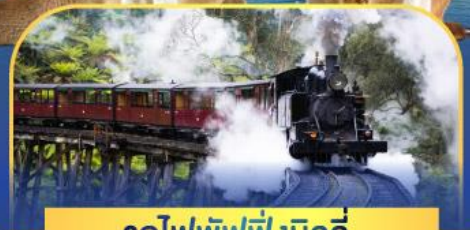
รถไฟพัพฟิงบิลลี่

ล่องเรือชมอ่าวซิดนีย์พร้อมรับประทานอาหารกลางวัน และ เข้าชมสวนสัตว์การองก้า