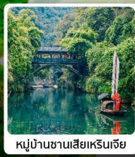
หมู่บ้านซานเสี่ยเหรินเจีย