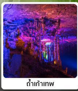
ดำเก้าทพ