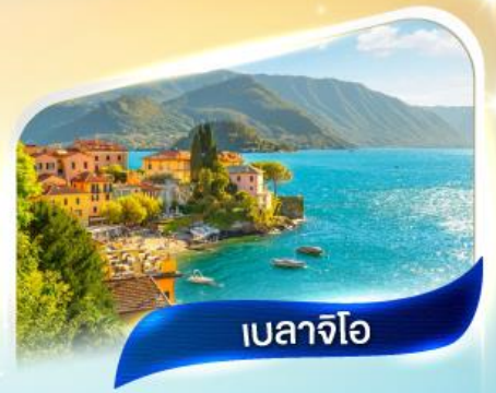
เบลลาจิโอ