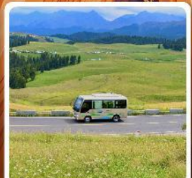
ทุ่งหญ้าเจียนปูลาเค่อ